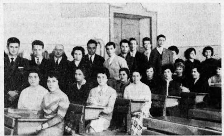
Dijaki realne (levo) in klasične (desno) gimnazije, ki so letos položili zrelostne izpite