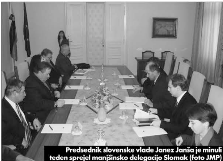
Predsednik slovenske vlade Janez Janša je minuli teden sprejel manjšinsko delegacijo Slovak

o javnih uslužbencih, ki omogoča zamenjavo visokih državnih uradnikov, s katerimi ministri iz političnih ali čisto osebnostnih razlogov ne bi mogli sodelovati, je opozicija reagirala tako, da je omenjeno dopolnitev zakona predložila v presojo ustavnemu sodišču.