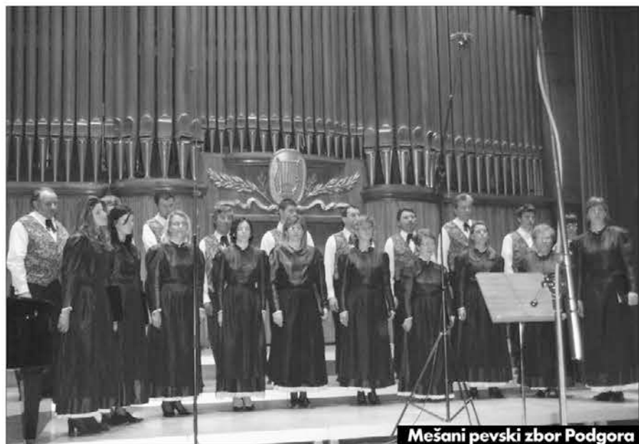
Mešani pevski zbor Podgora

ljubiteljev slovenske zborovske pesmi. Potekala je namreč tradicionalna revija Koroška poje, ki