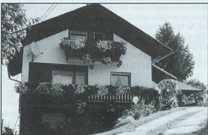
2.mesto: kmetija Širec; gospodinja Slavica Širec