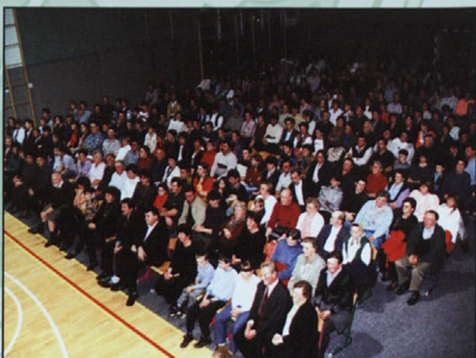
Gledalci so napolnili telovadnico OŠ Žetale