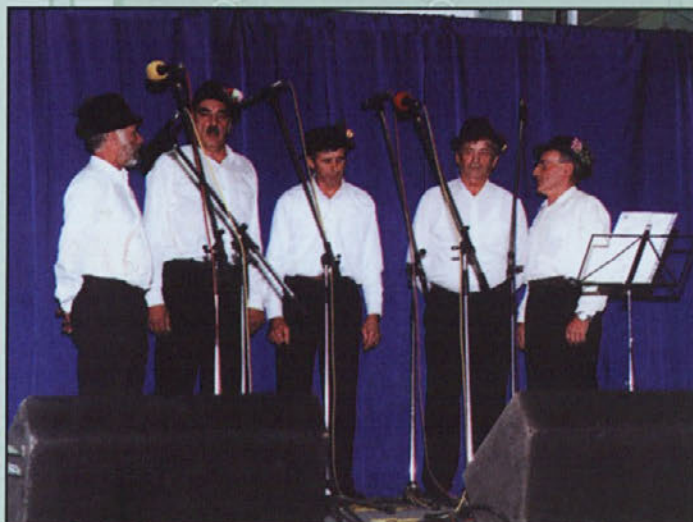
Ljudski pevci Foklornega društva Lancova vas