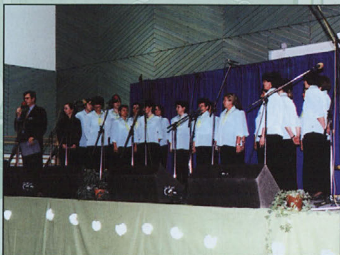
Ženski pevski zbor