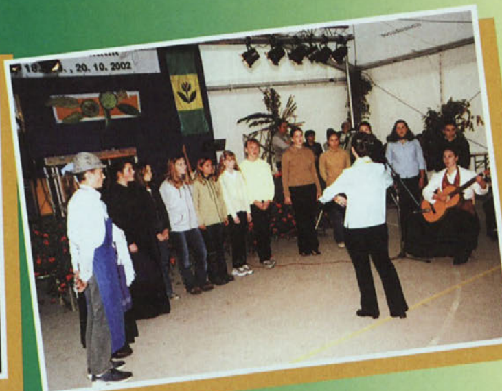
Prijeten nastop učencev OŠ Žetale