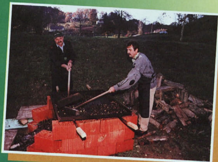
Milko in Albert sta pridno pekla kostanje ...