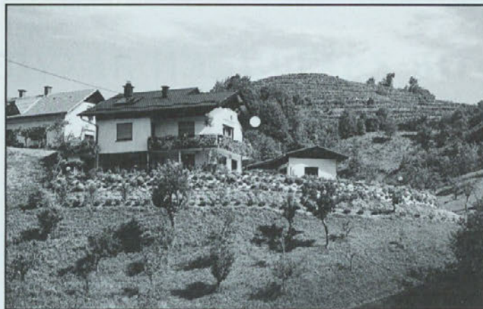
1.mesto: gospodinjstvo Železnik; gospodinja Hilda Železnik