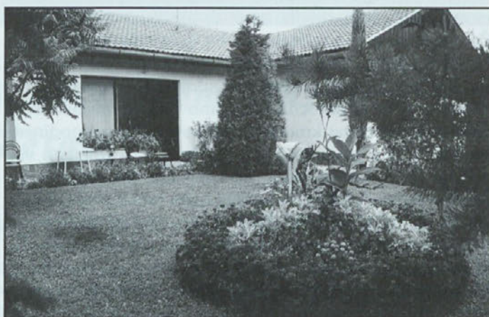
2.mesto: gospodinjstvo Polajžar; gospodinja Majda Polajžar