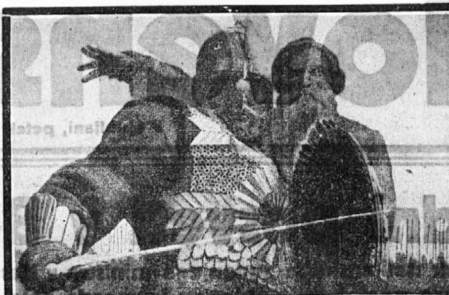
Danes premiera ruskega zgodovinskega vefilma