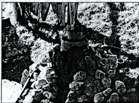
Pripravljena ilovnata peč v Logu pri Bohinjski Bistrici