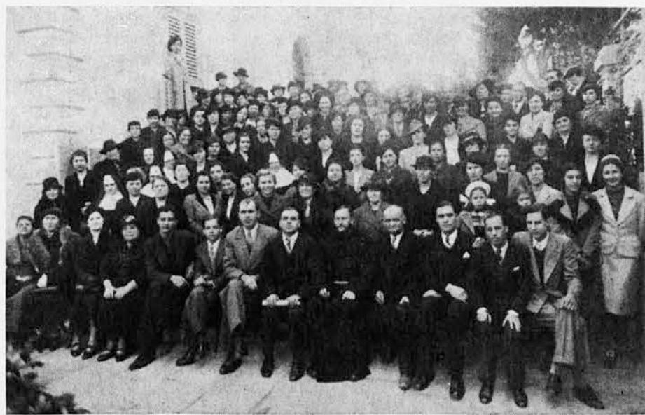
Skupna slika primorskih Slovencev, posneta leta 1937 v Aleksandriji (Egipt) ob slovesni procesiji s sliko Svetogorske Kraljice

Tudi letos smo sestre sklenile, da se pridružimo koprski škofiji in praznujemo v tej naši prisrčni kapelici Svetogorsko Marijino leto ob 450-letnici prikazovanj. Svetogorska Kraljica naj nam pomaga k duhovni poglobitvi, naj blagoslovlja naš delokrog in zbuja nove poklice.