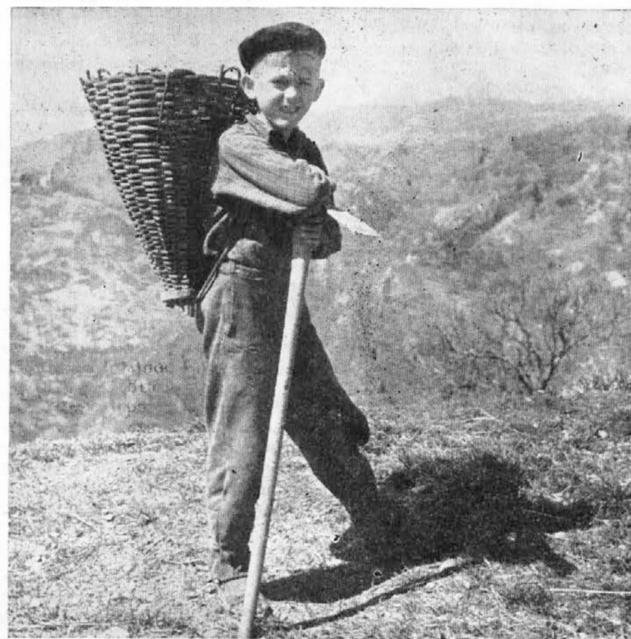
Pri nas morajo otroci mojih let pozabiti na igranje, da olajšamo delo materi, ki se že itak trudi od zore do mraka, ker ni očeta doma. Dobro se nam zdi, ko nam ložijo na rame košek rekoč, da znamo opravljati delo odraslih.