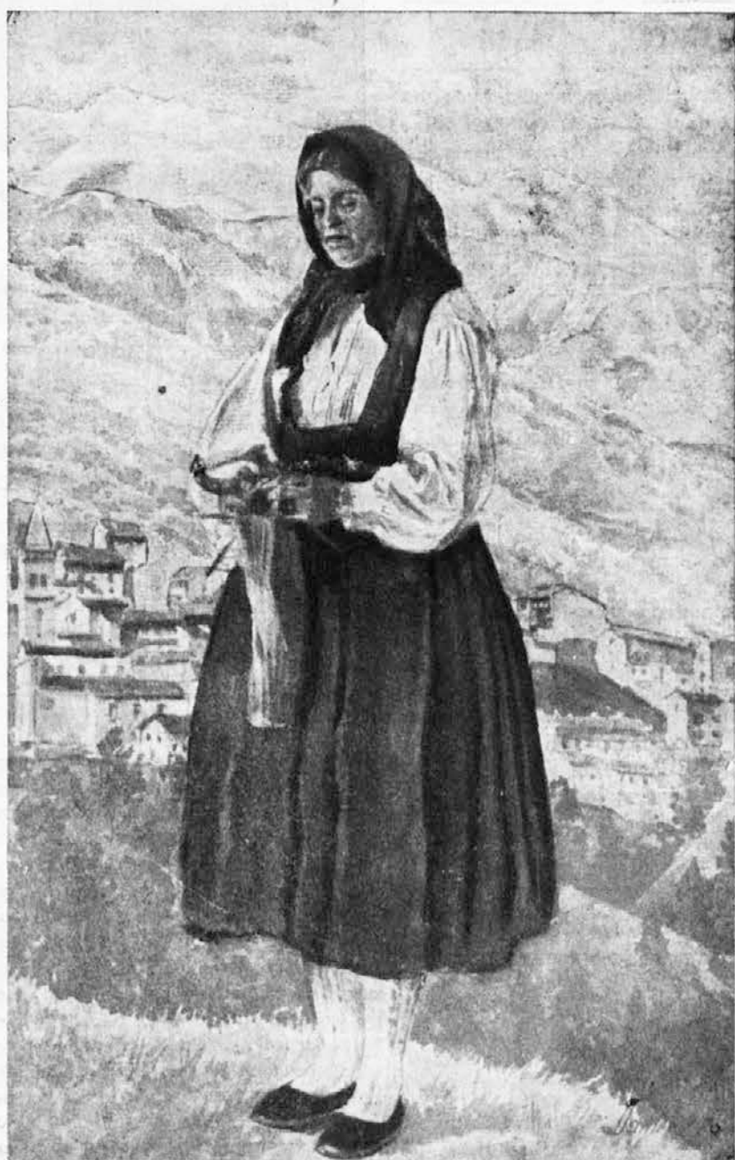
REZIJANSKA NARODNA NOSA, V KATERO SE KAJ RADE OBLECEJO DOMACINKE OB RAZNIH SVEČANOSTIH LEPO JIH JE GLEDATI, KO SE VRTE V PISANIH KRILIH OB POSKOČNIH ZVOKIH ZNANE »REZIJANKE«.

Potovanje predsednika ljudske skupščine L. R. Slovenije je zbudilo pozornost posebno italijanskih ekonomskih krogov, kar pričajo komentarji velikega italijanskega ekonomskega tiska. Ta pravi, kako se italijanska-jugoslovanska trgovinska izmenjava razvija prav ugodno v zadnjih letih v interes ekonomij v obeh državah.