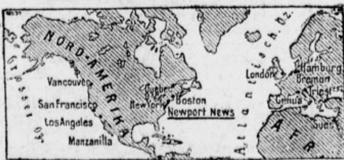
Zemljevid k interniranju nemške pomožne križarice »Eitel Friedrich«.

Genf, 12. aprila. Neka belgijska osebnost, ki je v tesnem stiku z belgijsko in angleško vlado, je izjavila poročevalcu li