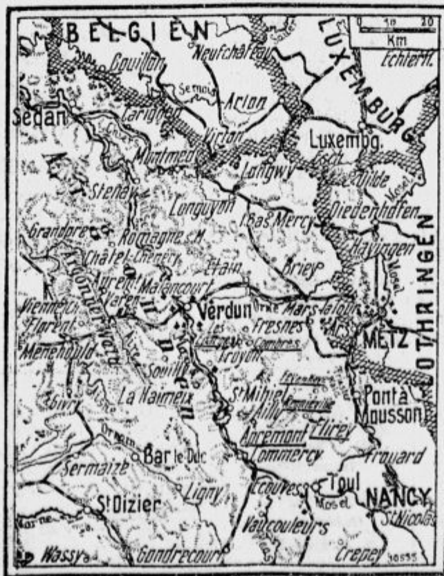
Zemljevid k bojem med rekama Mozela in Maas.

»Frankfurter Zeitung« poroča: Straßburski guverner je pod kaznijo z ječo po vojaški postavi prepovedal v javnosti govoriti francosko.