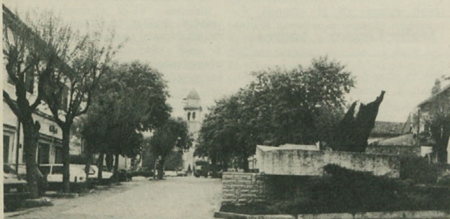
Spomenik padlim v NOB