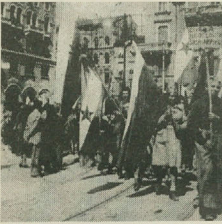
zavzele Pivko (takrat Šempeter na Krasu) in da so se že približale Trstu.

Napetost je bila skoraj neznosna. Ponekod so pripravljene borcem popustili živci; niso se mogli upreti in so začeli razoroževati zlasti enote Mestne garde, druge kvasilniške skupine in celo Nemce, če je bila priložnost. Tako so borci drugega sektorja ustavili pri Sv. Alojziju manjšo nemško skupino in jo razorožili ter zaplenili kamion z orožjem in strelivom. Tudi v Škednju so še pred časom začeli z vstajo. Razorožili so skupino 17 pripadnikov Guardie civiche. Ko je prišlo povelje za vstajo, so že imeli 80 do zob oboroženih borcev in so z njimi zaprli vse dohode v Škednj. Skoraj hkrati so že razorožili vso Mestno gardo v bivši karabinjerski postaji in povsem zagospodarili v Škednju.