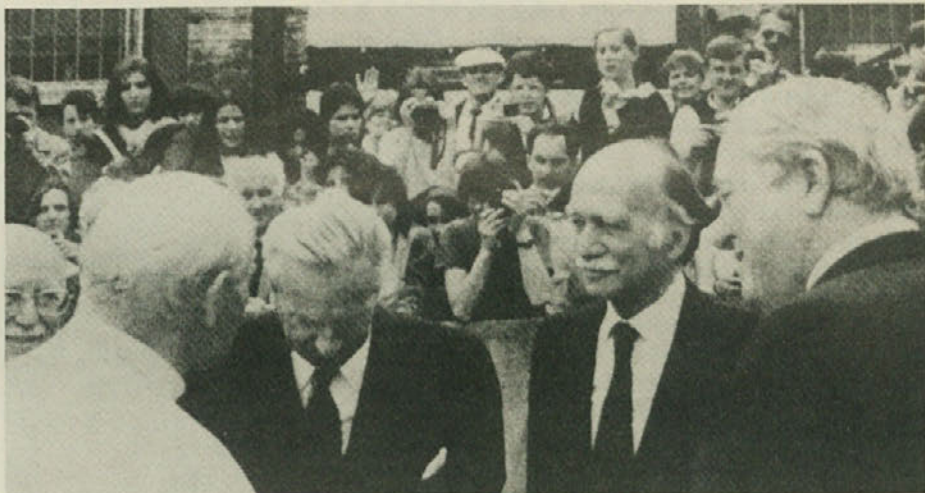
Papež Janez Pavel II sprejema Almiranteja in druge predstavnike evropskega fašizma.

Kaj je povezovalo predstavnike različnih pogledov na svet? Predvolilna propaganda spretno zrežirana na osnovi antikomunizma. Kakršnokoli vprašanje so postavili očitno skrbno in 'pluralistično' izbrani državljani, trije parlamentarci so ga dobrodošlo izrabili za napad na krajevne komunistične uprave, kot če bi komunisti upravljali vse italijanske občine. Niti besede o drugih strankah. Ko se je oglasil en samcat poslušalec s protiargumenti, ga je pohvalil 'pluralistični moderator', kot se potreplja otroka, ki se vmeša v pogovor odraslih, a ni dovolil, da bi se razprava razvila, kaj šele, da bi politiki morali odgovarjati. Očitno je, da obstaja v Italiji atavičen strah pred 'prehitevanjem', razen v cestnem prometu