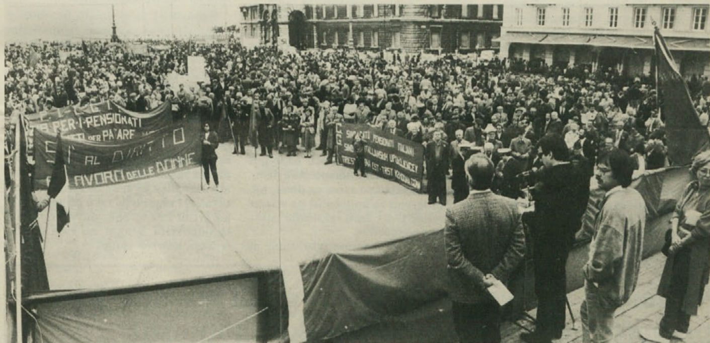
Mogočna manifestacija na velikem tržaškem trgu za mednarodni praznik dela in 40-letnico osvoboditve

blemih domačega slovenskega prebivalstva. Po rezultatih 12. maja bomo vedeli, ali bo problem beneških Slovencev v zaščitnem zakonu še vedno tako trd oreh ali pa se bodo razmere spremenile. Naš skupen interes je, torej, da se v Benečiji na občinskih volitvah uveljavijo napredne domače liste, ki so izraz enotnosti vseh progresivnih sil. To enotnost je bilo mogoče uresničiti skoraj povsod, kar daje upati v lep uspeh. Žal pa so tudi posamezni primeri, kjer je prišlo v naprednih vrstah do cepljenja, kar koristi samo demokristjanom in konzervativnim silam. Še posebej moramo omeniti Šentlenart, kjer je KD preživljala hudo krizo prav nekaj dni po tem, ko je tamkajšnji demokrščanski župan šel v Rimu ponavljat staro krilatico, da v Benečiji ni Slovencev in da ne marajo zaščite. Sporom in ločevanju v vrstah KD bi morala slediti še večja enotnost naprednih sil, ki so imele (in še imajo)