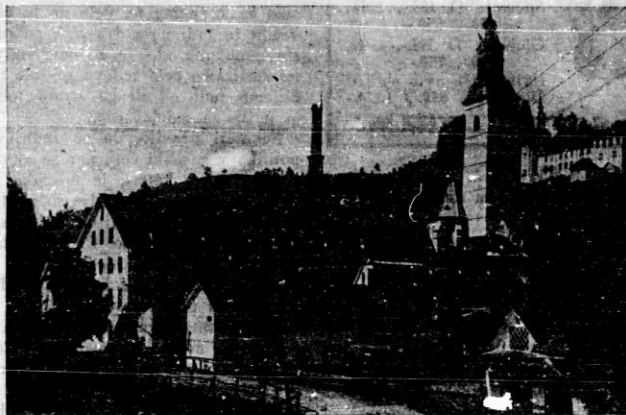
Škofja Loka — Tovarna klobukov „Sešir“.

močmi dvignili prapora gospodarskega napredka. Saj je blagostanje vsem ljubilo in je vsem jako draga misel, da se ljubljena Loka in njena deželica gospodarsko povzdigne. Zato so se znašli v objemu obrtniki raznih strank, zastavili svojo krepko dlan na plug in zdaj družno orjejo plevelno njivo gospodarstva. Kako razveseljivo je, da znamo včasih pozabiti na svojo usodno razcepljenost in tuintam tudi brez prevare, zapostavljanja ali nadvladanja skupno nastopiti. Seveda je treba zato pametnih glav, ki ločijo pojem gospodarstva od pojma kulturnega nazora. Smo proti vsakemu niveliranju mišljenja. Vsak naj ima svoje jasne nazore in naj se dosledno po njih ravna, brez slepomišljenja in paktiranja. Kadar pa gre za gospodarsko vprašanje, za naš kruh, združimo roke pri skupnem delu! Po teh smernicah se je ravnal razstavni odbor. Niso se spraševali, ali si Peter ali Pavel, samo da si pošteno delal. Kdor je več naredil, ta je bil med obrtniki vplivnejši in bolj upoštevan.