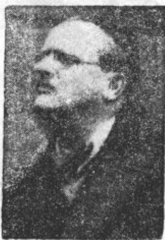
Ruski poslanik v Parizu, ki je padel kot politična žrtev zloglasne Čeke.

stopke in zločine, ki se pripisujejo obtožencem. Karel Radek je govoril dve uri. Ugotovil je, da so bili v procesu podani mnogi tehtni dokazi o delu in moči protirevolucionarne organizacije Leva Trockega. Sam je to organizacijo obeležil kot sprednjo stražo sil, ki se pripravljajo za novo svetovno vojno. Trocki je postavil svojo organizacijo pred izvršena dejstva, tako da je bila prisiljena odzvati se njegovim pozivom k sabotaži. Poleg obstoječega centra je pričel Trocki ustanavljati še drugo tajno teroristično organizacijo, ki doslej še ni bila v celoti demaskirana. Sokolnikov je v svojem poslednjem na-