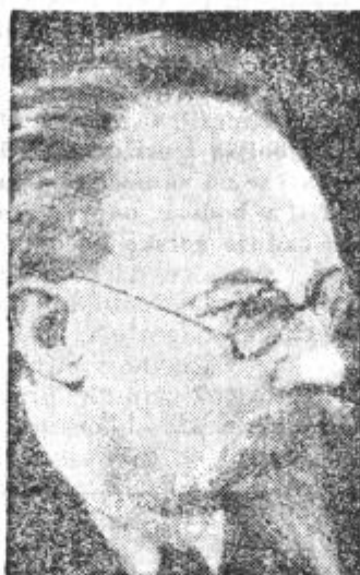
Pjatakov, eden izmed glavnih kolovodij veleizdaje, ki je bil v moskovskem procesu obsojen na smrt z ustrelitvijo.

Na koncu razprave so govorili zagovorniki obtožencev, deloma pa so obtoženci sami govorili v svojo obrambo. Pjatakov je ponovno potrdil izpovedi, ki jih je podal pri zaslišanju. Obžaloval je, ker Trocki ni prisoten. Govoril je kratko in poudaril, da je državni tožilec točno podal sliko dogodkov kakor tudi posamezne pre-