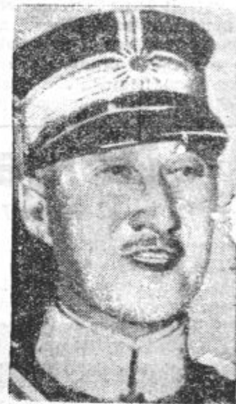
Japonski general Terauchi, predstavnik vojaške stranke in velekapitala, ki se bori proti parlamentarizmu na Japonskem.

V utemeljitvi obsodbe je med drugim navedeno, da je v Rusiji obstojala tajna centrala trockistov, ki je delala zelo intenzivno po navodilih svojega voditelja v tujini. Centrala je skušala prevrniti sovjetski red, obnoviti kapitalistično družbo in izročiti oblast buržujem. Pri tem svojem delu se je centrala posluževala gospodarske in politične sabotaže, terorističnih dejanj in priprav za vojaški napad na Rusijo od zunaj. V ta namen so se trockisti pogajali z zastopniki Nemčije in Japonske. Lev Trocki se je pogajal tudi z nemškim ministrom in zastopnikom voditelja nemške narodne socialistične stranke Rudolfom Hessom. Trocki je pri tej priliki sprejel razne obveznosti za primer, če bi v sovjetski Rusiji nastopila vlada trockistov. Nemški vladi je ponudil teritorialne in gospodarske