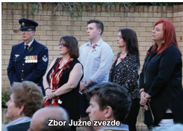
Zbor Južne zvezde