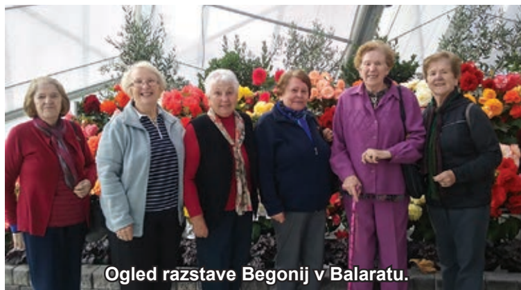
Ogled razstave Begonij v Balaratu.