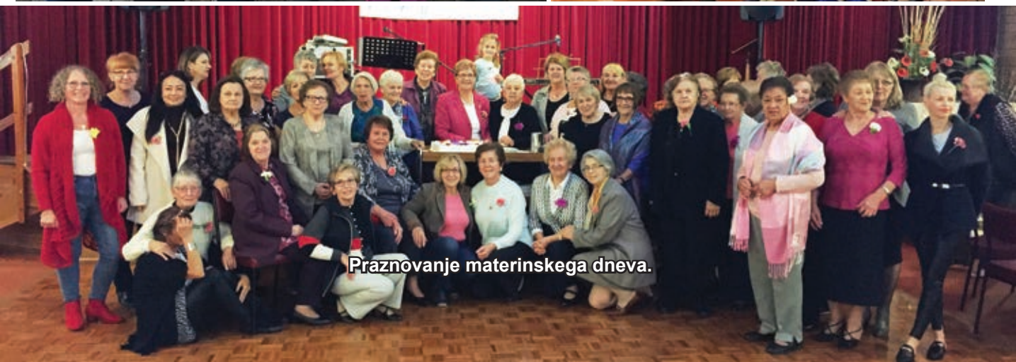
Praznovanje materinskega dneva.