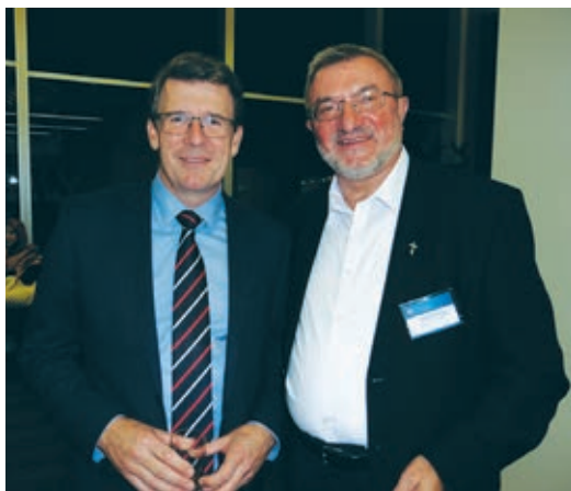
Minister The Hon Alan Tudge MP in p. Ciril.

Federal Minister for Citizenship and Multicultural Affairs, The Hon Alan Tudge MP, to discuss the Government's commitment to maintaining our successful multicultural society, based on fostering integration and social cohesion.