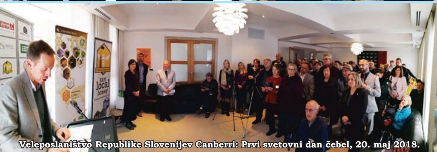
Veleposlaníštvo Republike Slovenije v Canberri: Prvi svetovni dan čebel, 20. maj 2018.