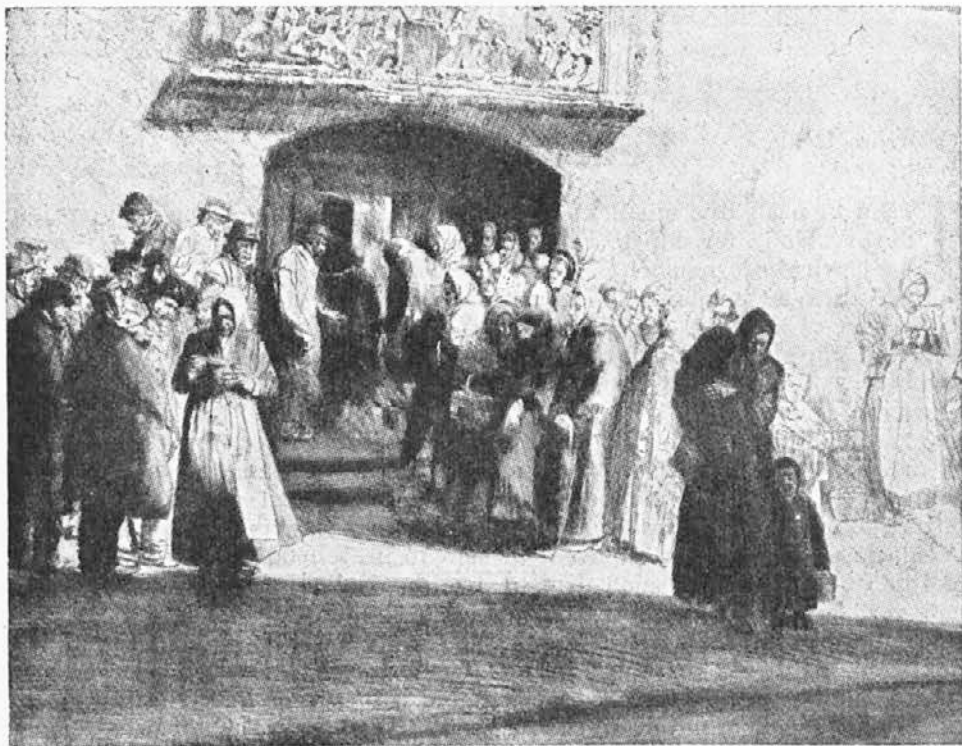
Po lonček juhe . . .

Prvo, s čimer bi morali začeti v naših vrstah, je več samovzgoje v miselnosti, čustvovanju in delu krščanske ljubezni. Široko neobdelano polje čaka tu vsakogar, ki je dobre volje. Pa še kaj drugega mora priti zraven. Vsak, o današnjih socialnih razmerah le za silo poučen, mora vedeti, da Cerkev in krščanska družba ne more vršiti danes svojega prvenstvenega poslanstva brez organizirane krščanske karitas. Vselej v zgodovini, ko so