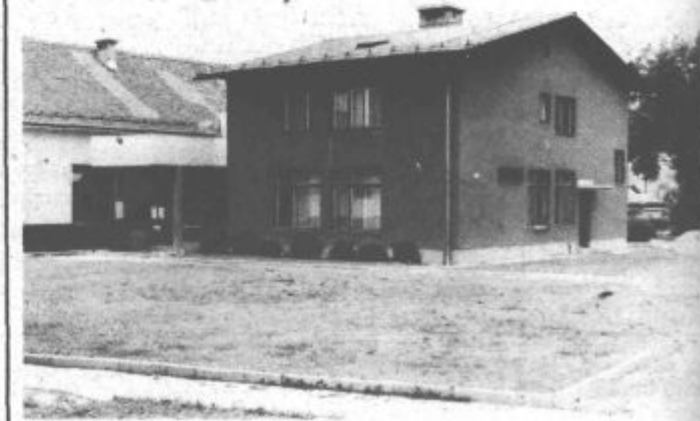
Veliko dela pri urejanju zelenic in pešpoti so že opravili, precej natog pa jih še čaka