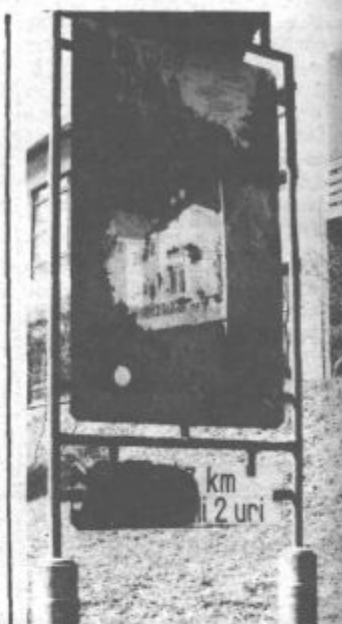
K dobri turistični ponudbi ne sodijo zarjavele table

Bo do pričetka šolskega leta 1985/86 na območju šole v Paki že znano vsakemu turistu, tujcu in manj pozornemu vozniku, da je nevarnost za prometno nesrečo večja? Preizkusimo operativno sposobnost občinskih organov in