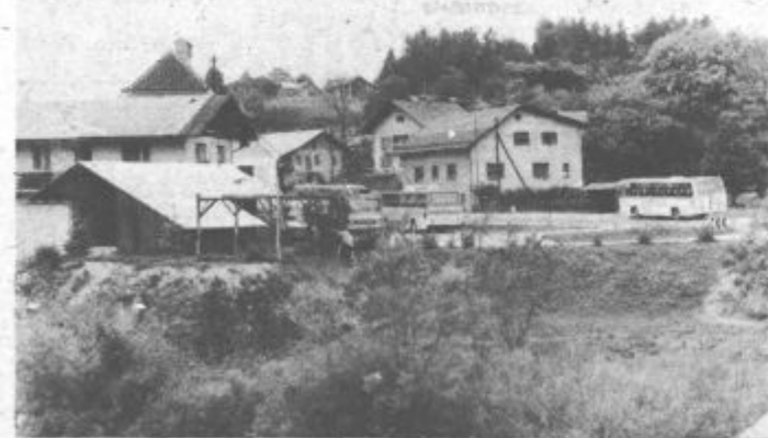
V Letušu bi radi posodobili 1600 metrov krajevne ceste, vendar nimajo dovolj denarja. Le volja in pripravljenost krajanov pa sta premalo.