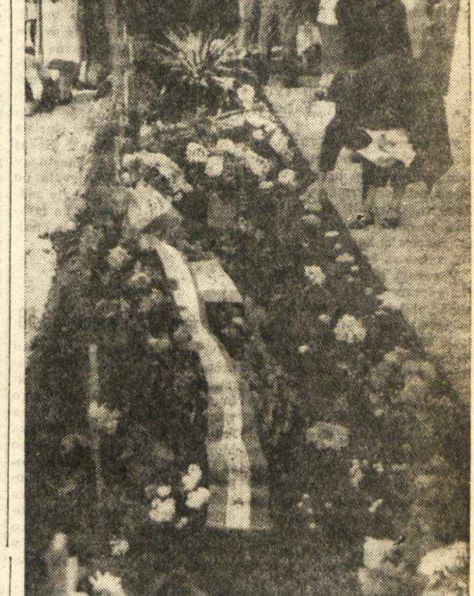
Na grobu vojakov JLA na pokopališču na Opcinah

Tudi na mestu kjer je bila obešana kot talca tovarišica Rozalija Gulič na Opcinah.