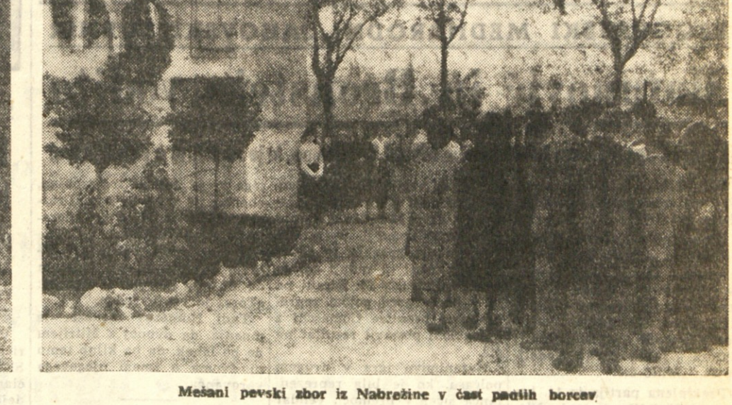
Mešan pevski zbor iz Nabretine v čast padlih borcev