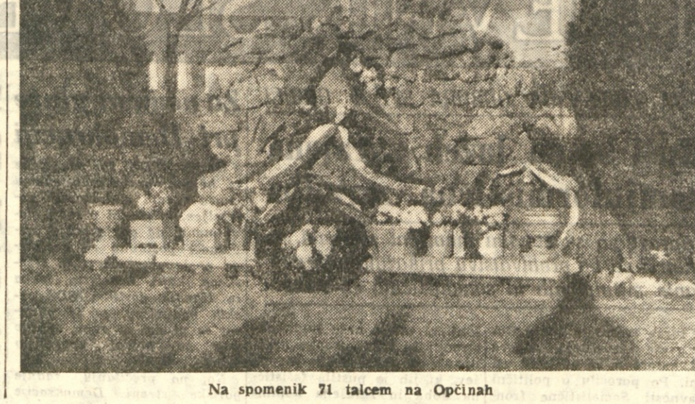
Na spomenik 71 talcem na Opcinah

Toda ta negroidna rasa ni bila razširjena samo v Evropi, ampak tudi v južni Indiji, Indokitsajski, Polinezijski in Melanezijski. Danes so se negroidi ohranili na Filipinih, v Novi Gvineji, v pragozdovni Melanezijski in se drugje. Njihova srednja višina od 1,44 do 1,52 m. Med negroide pršteujemo tudi današnje Bede in Ceylona, katerih je samo nekaj sto živje pa kot v kamni dobi. Njimi podobni so Dravidi, ki živijo v Indiji. Po nekaterih znanstvenih podatkih je naštetih na sledove negroidov tudi v Srednji Kitajski. Po starih kitajskih kronikah, so na začetku kitajske zgodovine imeli majhni črni ljudje sredi današnjega kitajskega ozemlja svojo močno kraljevino. Na Japonskem in Formozu so negroidi povsem izginili, ostale pa so njihove lobanje, in tudi legende pripovedujejo o strašnih bojih s črnimi ljudmi. V nekem japonskem pregovoru je rečeno, da mora vsak samuraj imeti v sebi vsaj nekaj kapljice črne krvi, če hoče biti pravi junak. Nekoč so bili negroidi gospodarji vse Afrike. Njihova fosilizirana okostja so se našla po vsem kontinentu. Visek svoje moči so bržda dosegli konec zadnje ledene dobe, ko Evropa še ni bila ločena od Afrike in Sahara sploh ni obstajala.