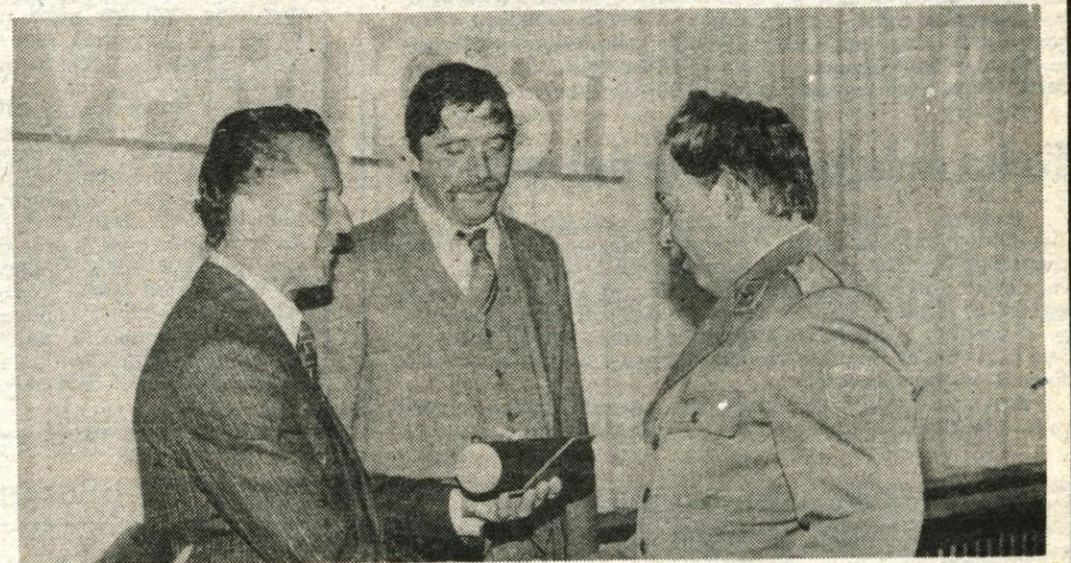
Brdo pri Kranju, 13. maja — V spomin na 13. maj 1944. leta, ko je maršal Tito v Drvarju podpisal odlok o ustanovitvi oddelka za zaščito naroda (OZNA), slavijo delavci organov za notranje zadeve svoj praznik — dan varnosti. Delavci gorenjskih organov za notranje zadeve so se v sredo zbrali na slovesnosti na Brdu, kjer so najzaslužnejšim podelili državna odlikovanja; postaja GRS Mojstrana, Železniško gospodarstvo Ljubljana, tozda za tehnično vozovno dejavnost, delovišče Jesenice in Radio Triglav Gosposcice so prejeli plakete ONZ, 38 delavcev srebrne in bronaste znake "za sluge za varnost", 25 delavcev pa pismene pohvale.

Sejem kooperacij, industrije, trgovine in drobnega gospodarstva