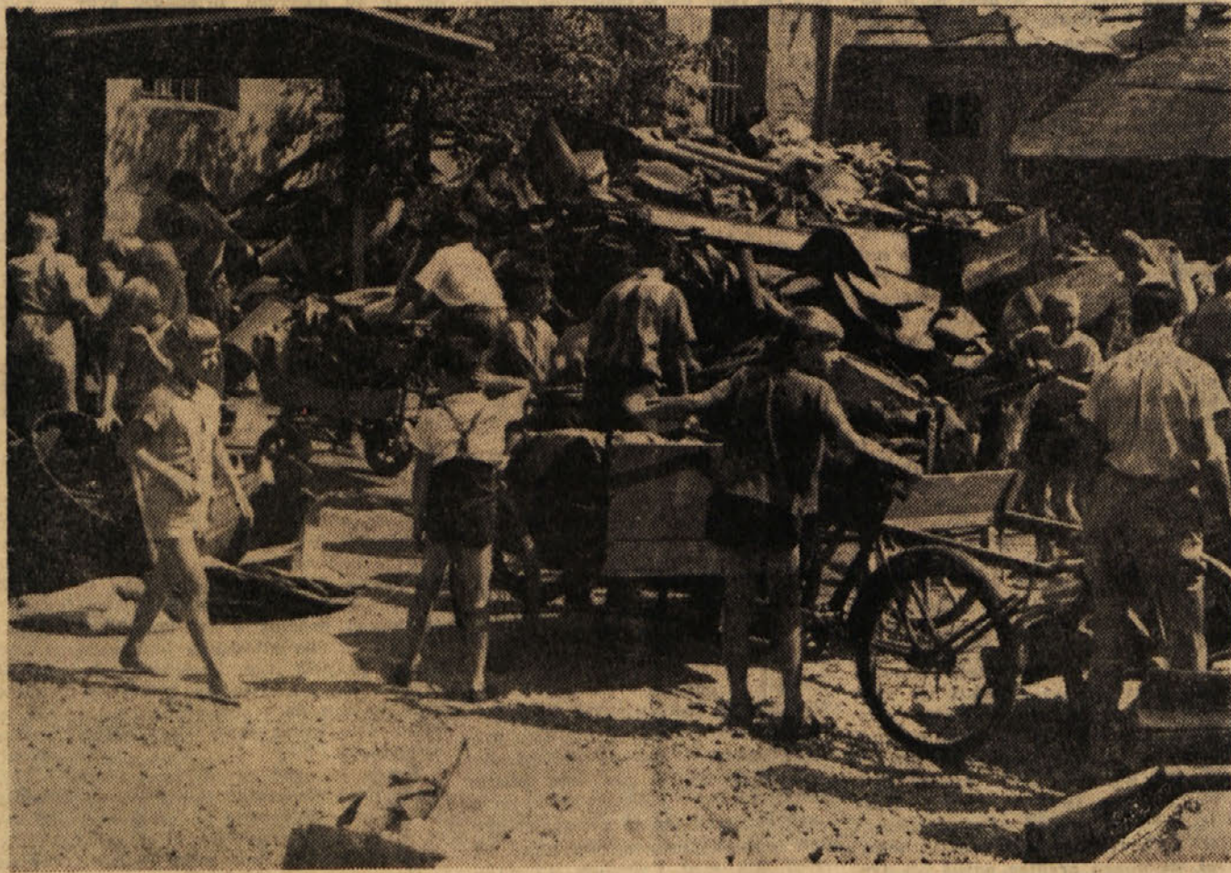
PREDNI ZBIRALCI STAREGA ZELEZA, KRF, PAPIRJA IN DRUGIH ODPADKOV SKRBE, DA DOBE ODKUPNE POSTAJE »ODPADKOVOLJ SUROVIN

Minister za industrijo sirske pokrajine Združene arabske republike Saman je sporočil v Damasku, da so naši državi poverili dobavo opreme za gradnjo sirskega naftovoda. Vrednost posiljk je 24 milijona dolarjev. Tako bo ZSSR 50 km brezvlivnih cevi za naftovode.