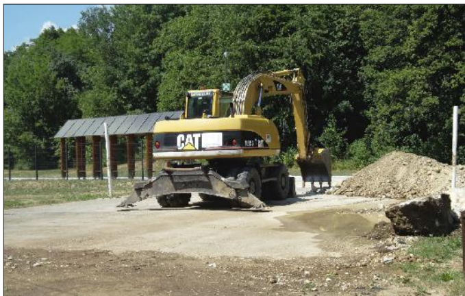
Dela v okolici šole.

Hitro se bliža konec poletnih počitnic in prvi šolski dan. Upamo, da ste poletje lepo preživeli in se veseli in zdravi vračate v šolo, ki za vas odpira vrata v ponedeljek, 2. septembra.