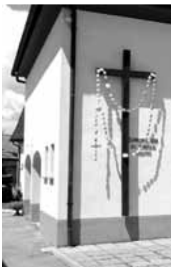
Tudi tak je rožni venec.