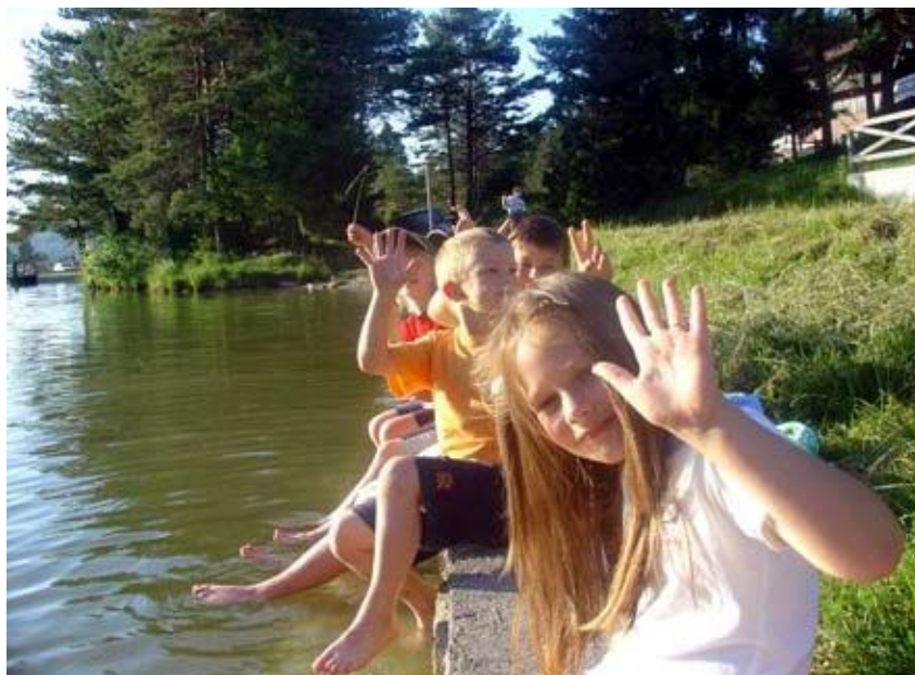
Pozdrav Sloveniji.