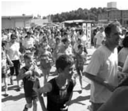
Stari in mladi – tečejo radi.