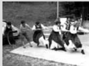
Hooooooruk – do avtomobila...