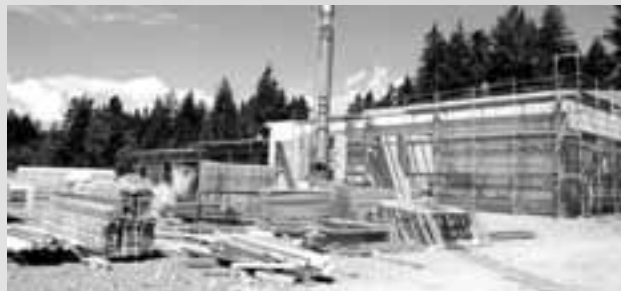
Avtocestna baza se izgrajuje.