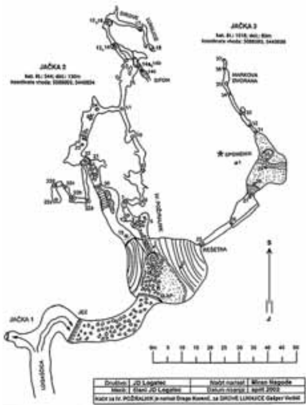
Tloris ponornega dela Logaščice in požiralnikov.

Ves čas najinega garanja v meandru je skozenj zelo občutno vleklo in sicer iz jame. Zrak mimo naju je bil zelo svež in niti malo ni zaudarjal po Logaščici, ki ima zelo prepoznaven vonj. Bolj ko sem razmišljal o prepihu, manj mi je bilo jasno, zakaj sploh piha in to celo navzven. Da se pojavi prepiph, mora obstajati določena višinska razlika