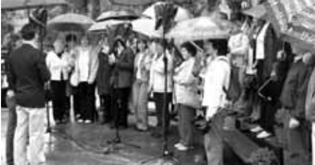
Pesem zadoni tudi izpod dežnikov.

Peli so zbori in skupine od Čedadada do Monoštra na 13. srečanju, naslovljenem »Ko pesem srca vname«