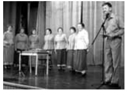
Gorenjski fant z gorenjskimi deklinami.