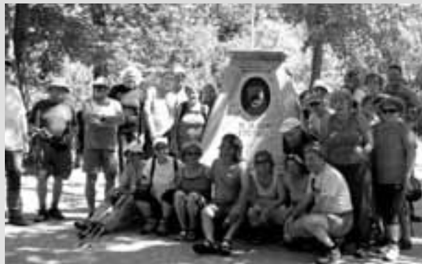
Na goričkem tromejniku: Avstrija-Madžarska-Slovenija.

V Krajinskem parku Goričko smo si ogledali grad, ki sto- ji v istoimenskem naselju na strmem griču v severozahodnem delu Goričkega. Zapiski o obstoju grajskega poslopja so iz leta 1275, obnavljajo ga od leta 1995. Vodnica nam je prikazala film o največjem baročnem gradu na Slovenskem, saj naj bi