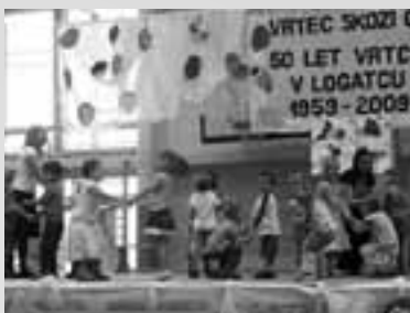
Radi tudi nastopamo.