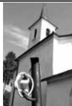
Ostanki zlohotne objestnosti.