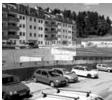
Bloki, garaže in avtomobilska gneča.

Energoplan iz Ljubljane gradi nad Pavsčičevo cesto dva nova bloka v novi soseski Zeleni grič s prek sto stanovanji in parkirnimi prostori.