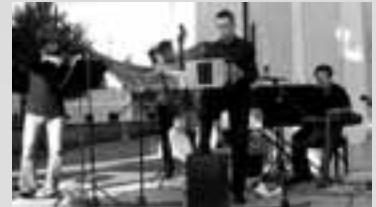
Virtuzni Quatro por tango.