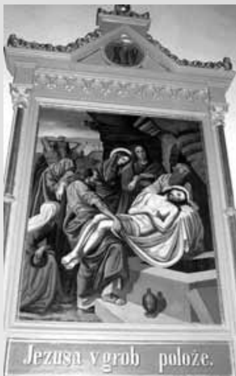
Jezusa v grob polože.

V 19. stoletju je bil zelo vpliven križev pot avstrijskega slikarja Josefa (von) Führicha (Slikar se je rodil leta 1800 v Chrastavi na Češkem, umrl 1876 na Dunaju), ki ga je v fresko tehniki naslikal med leti 1844-46 v cerkvi St. Johann Nepomuk na Dunaju. Ta znameniti križev pot je že v šestdesetih letih postal vzor za ta ikonografski cikel in poslej v slovenskih cerkvah skorajda ne srečamo nobenega križevega pota, ki ne bi nastal po tej predlogi. Med drugim se s kopijami/priredbami srečamo tudi v župnijski cerkvi Matere božje rožnega venca v Gornjem Logatcu, v župnijski cerkvi sv. Janeza Krstnika v Hotedršici, v podružnični cerkvi sv. Križa na Taboru (provenienca: župnijska cerkev v Dolnjem Logatcu) in v podružnični cerkvi sv. Luke v Grčarevcu. V prvih treh imenovanih primerih gre za oljne slike na platnu, v grčarevski podružnici (na podružnicah je bila vedno stiska z