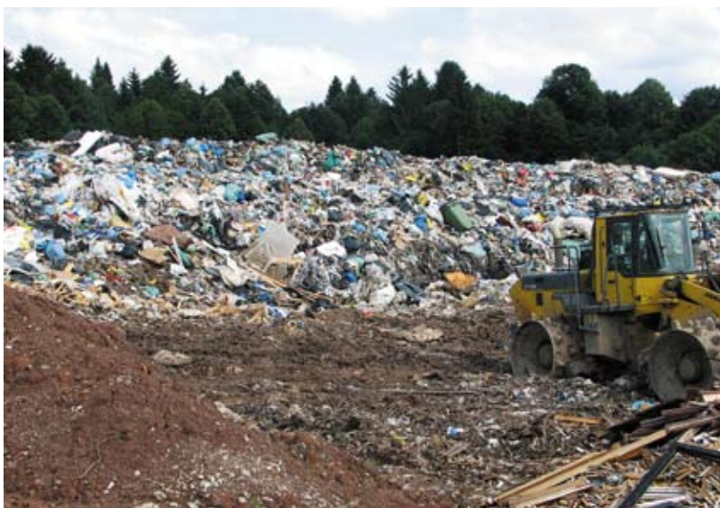
Odlagališče odpadkov Ostri vrh, še za 28.000 ton odpadkov.