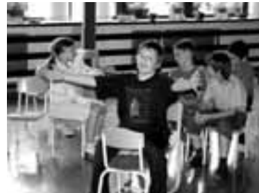
Toliko je bilo ustvarjalnosti.

U čenci so se 19. junija zbrali v prostorih POŠ Hotedršica, ki jim je gostoljubno dajala vse, kar je bilo potrebno za izvedbo tabora. Mentorice so mlade ustvarjalce na svoj predlog in na predlog učiteljic razporedile v tri delavnice: likovno, gledališko in literarno.