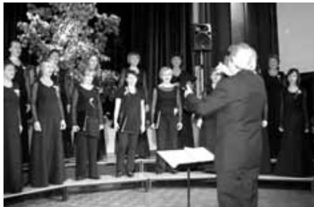
Visoka pesem izpod zelene lipe.

Koncertno prepevanje iz iskanja v svet nepresežnega