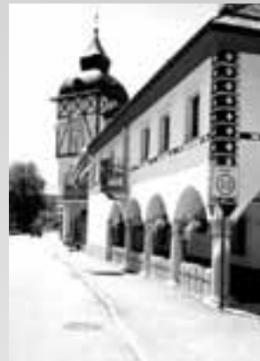
Besedilo in foto: Franc Brus

Prav bi bilo, če bi logaški občani ob državnih praznikih izobesili zastave na svojih hišah v prepričljivejšem številu. Tudi zaradi domoljubnega ponosa.