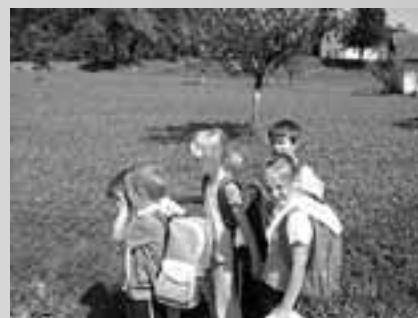
Na svidenje septembra!

različne generacije, kjer se ohranja vse tisto, kar je za kraj pomembno in vredno. In če se šola zapre, vse to ugasne. Zato niso prikrajšani samo otroci, ampak predvsem kraj, otroci še najmanj. Preprosto, lepo je na podružnici. Vrnjeno je tisto, zaradi