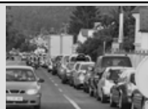
Pa naj se prebijajo skoz Logatec!