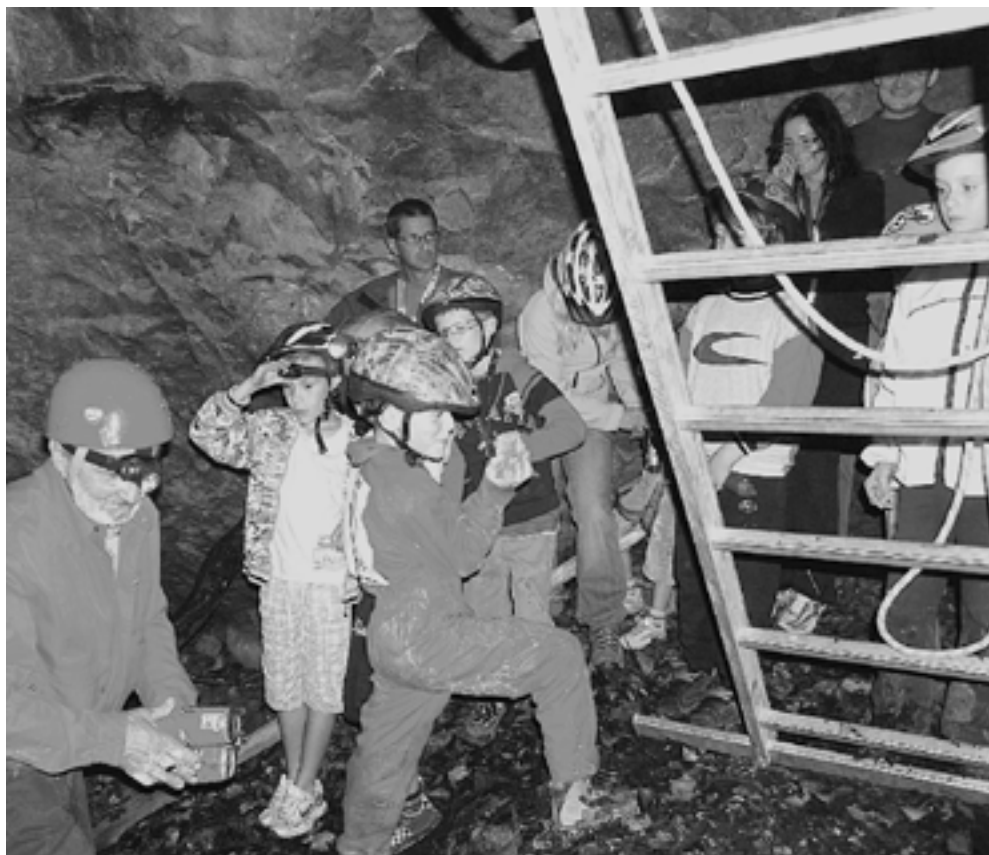
V Tomažinovem breznu.

Lani smo si ogledali Križno jamo . Vožnja s čolnom po podzemnem jezeru in ogromen podočnik jamskega medveda nam bosta za vedno ostala v spominu. Pa tudi to si bomo zapomnili, da smo bili zaradi deževja lačni – za ogenj je bilo