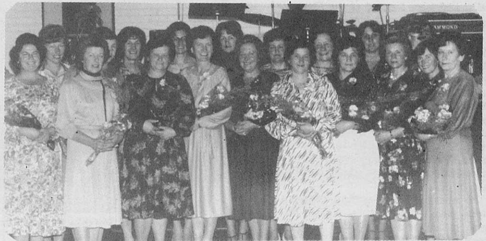
Skupina žena S.D.M., ki so dobile na proslavi materinskega dne priznanje za njih odgovornost pri delovanju S.D.M. v teku preteklega leta.

V splošnem se tudi ta večer lahko prišteje med ene najlepših, ki smo jih doživeli na našem Elthamskem griču. Pokazal je, da so taki večeri, ki so namenjeni izključno za člane najlepši način, da se še bolj trdno zavemo svoje povezanosti.