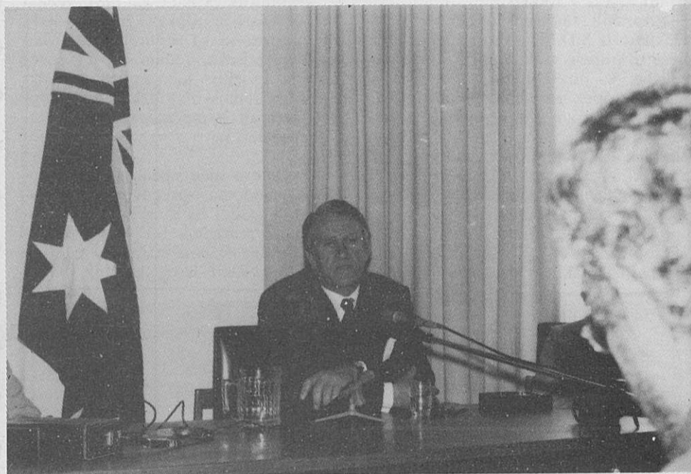
Prime Minister Malcolm Fraser na tiskovni konferenci za etnične časopise. — Našem fotografu se je posrečilo ujeti njegov nasmešek, čeprav mnogi menijo, da so njegovi nasmeški redki kot astronomi.

“Rad bi se povrnil na vprašanje Jugoslavije. Vsi vemo, da lahko v bližnji bodočnosti tam nastane delikaten položaj. Ali bo v slučaju, da bi Sovjeti izrabili tak položaj Avstralska vlada zavzela prav tako strogo stališče kot ga je v slučaju Afganistana?”