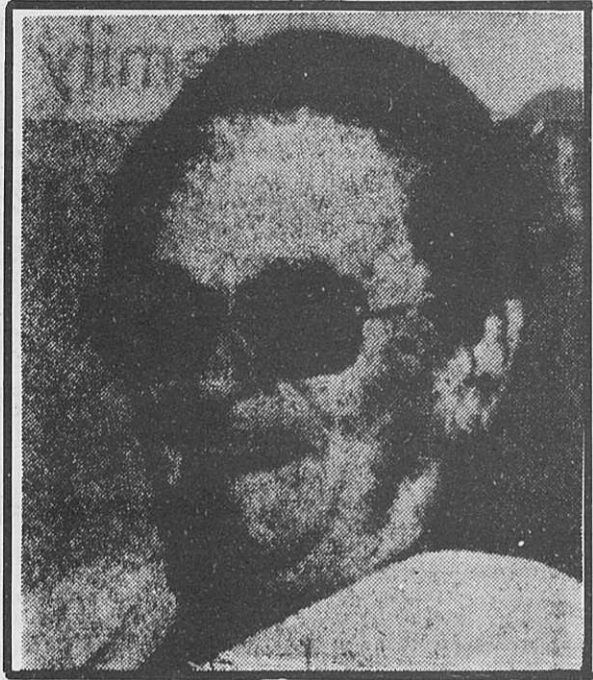
Zadnja fotografija Predsednika Tita po amputaciji leve noge v kliničnem centru v Ljubljani.

V četrtek 8. maja so v prisotnosti visokih predstavnikov skoraj vseh držav sveta položili truplo maršala Tita k večnemu počitku na Dedinju pri Beogradu. Tako se je zaključila zemeljska pot ene najmarkantnejših osebnosti, ne samo Jugoslavije, nego celega sveta.