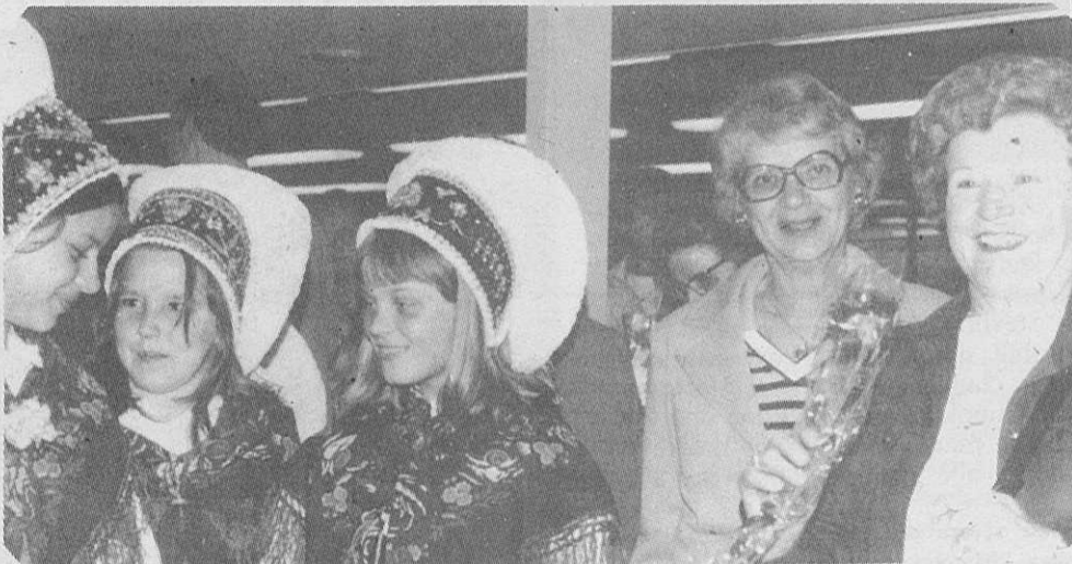
Avstralske in Ameriške Slovenke — dve generaciji Slovenk, že obe rojeni izven stare domovine.

dience with his fine playing wherever we traveled. He was asked to give some lessons and it looks as if a button box club will be started shortly in the Melbourne area with about half-a-dozen players.