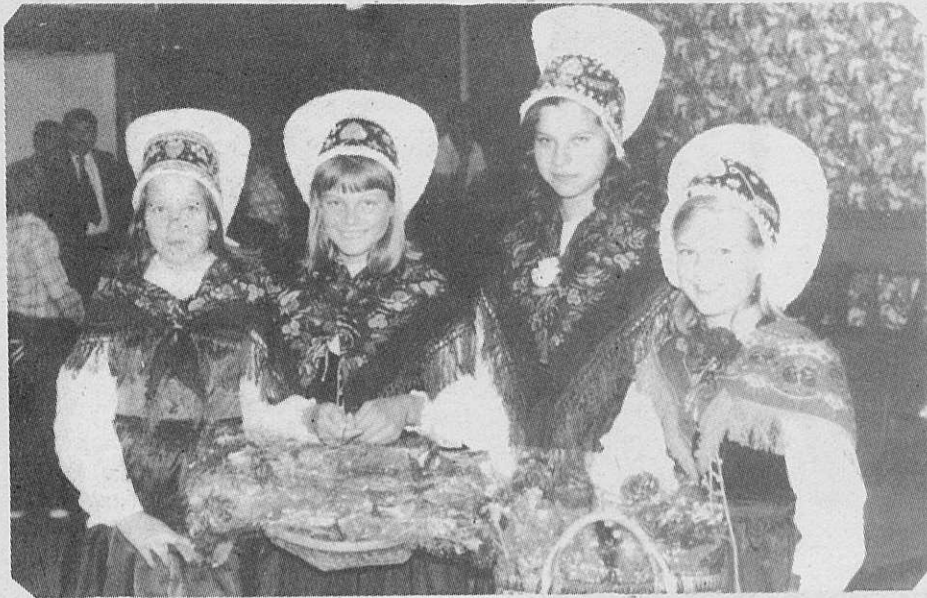
Dekletca S.D.M. pričaujejo "Amerikance" na letališču v Tullamarine.

Kakšen lep vtis so Ameriški Slovenci dobili o nas se razvidi iz članka, ki je bil objavljen v eni njihovih publikacij potem ko so se srečno vrnili domov z obiska v Avstraliji.