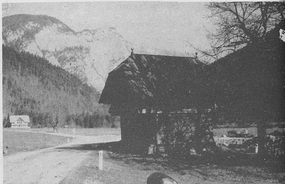
Motiv iz Logarske doline

14-dnevno potovanje na Havaje od $605 dalje!