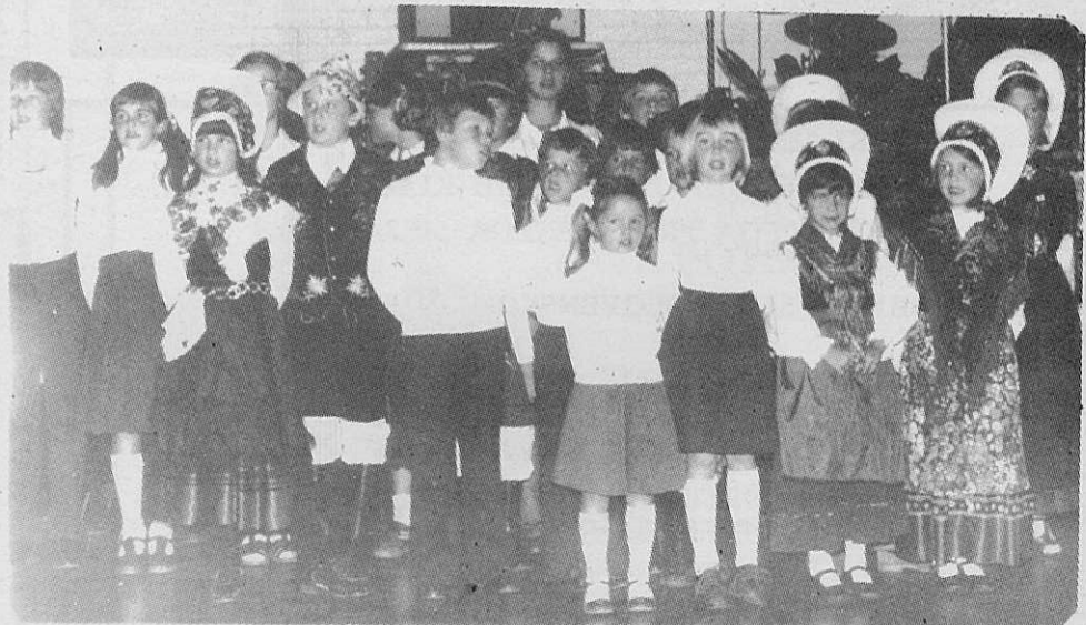
Otroci šole S.D.M., ki so pripravili spored za svoje mamicice pri proslavi materinskega dne.