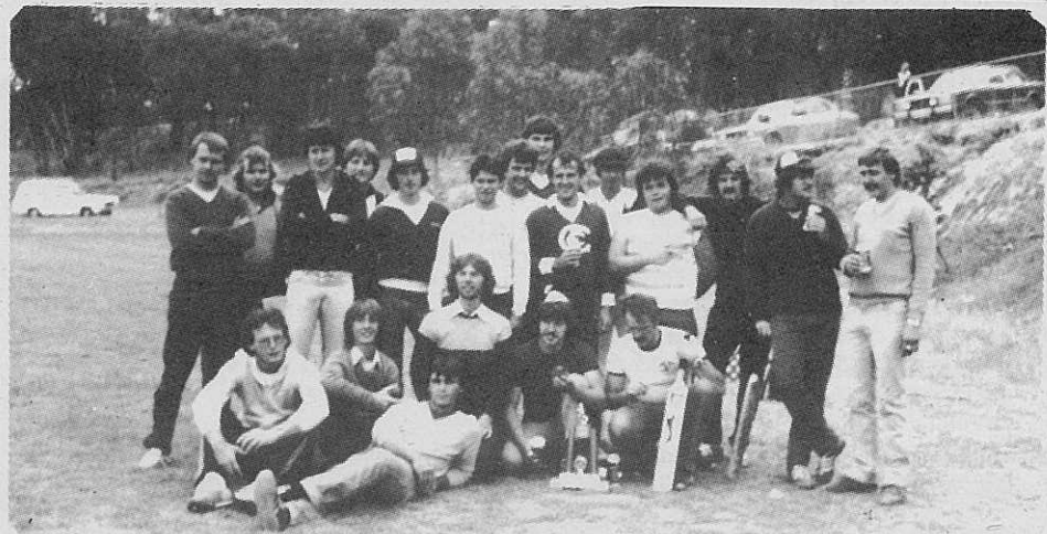
Mladinska odseka S.D.M. in "Planice-Springvale" sta se pomerila v cricketu.

One more presentation took place that night, which was the handing over of trophies to the winners of the S.D.M. Youth Car Rally, congratulations to the winners and thank you for your participation.