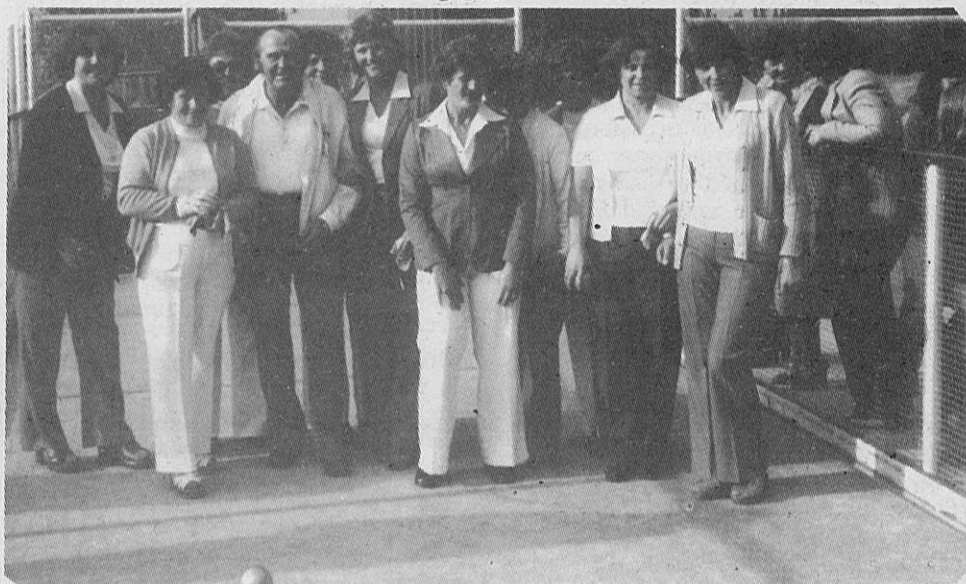
Ženski ekipe S.D.M. in Slovenskega društva iz Geelonga na tekmovanju 27. aprila 1980. na Elthamu.