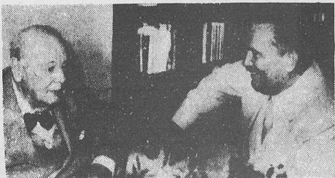
Predsednik Tito in Sir Winston Churchill na jahti milijonarja Onassis leta 1960.

Kaj bo prinesla bodočnost Jugoslaviji po Titu je tudi predmet svetovnega ugibanja in špekulacij. Na žalost bo, kljub morebitnim najboljšim namenom novega kolektivnega vodstva, Jugoslavija še vedno karta v rokah velesil, s katero bodo pokušale nadaljevati svojo igro za posest svetovnega bogastva.