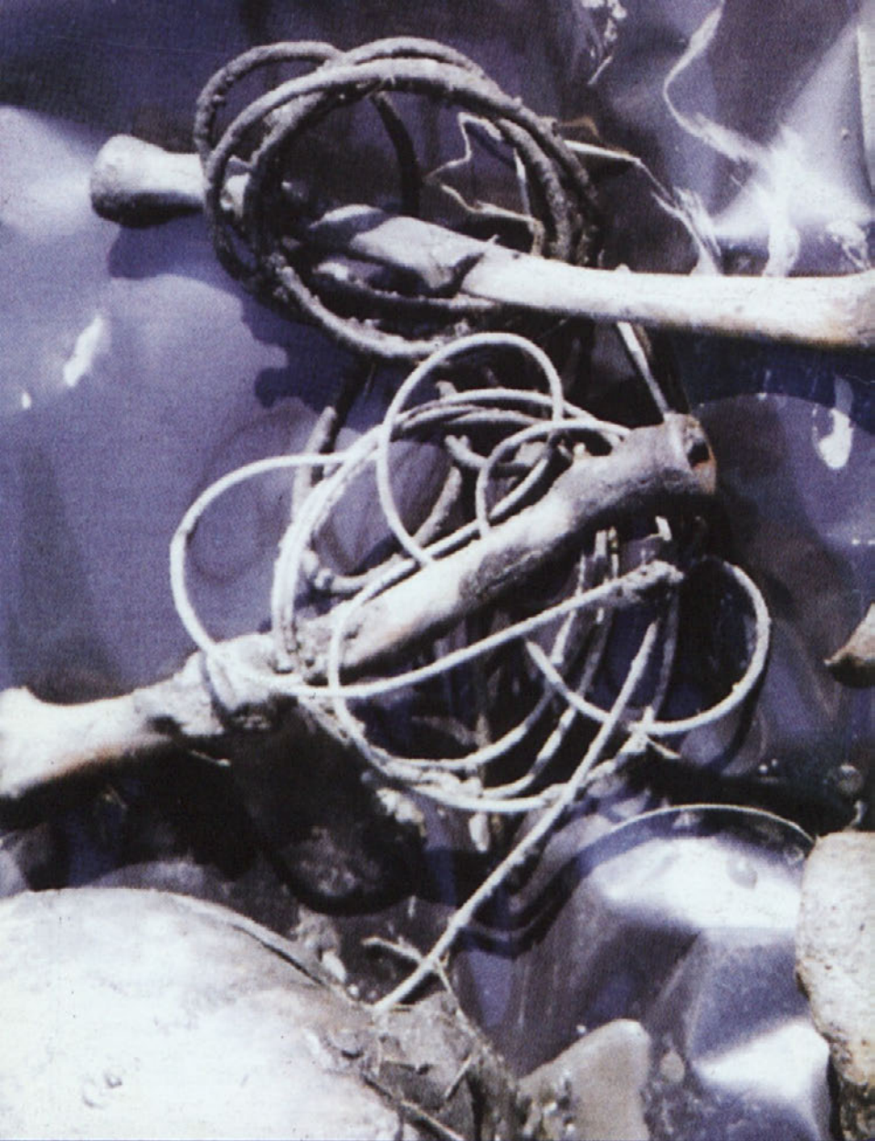
Zgornja Hudinja, žrtve so bile zvezane