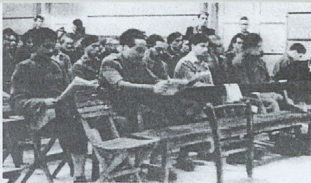
Grčarski četniki na sodni obravnavi v Kočevju.

Nihče nima pravice vsiljevati mnenja, posebno svojcem žrtev, to je ena izmed oblik boljševiskega totalitarizma. Njegovi nosilci se lahko le kesajo. Duh resnice je ušel iz zasutega groba.