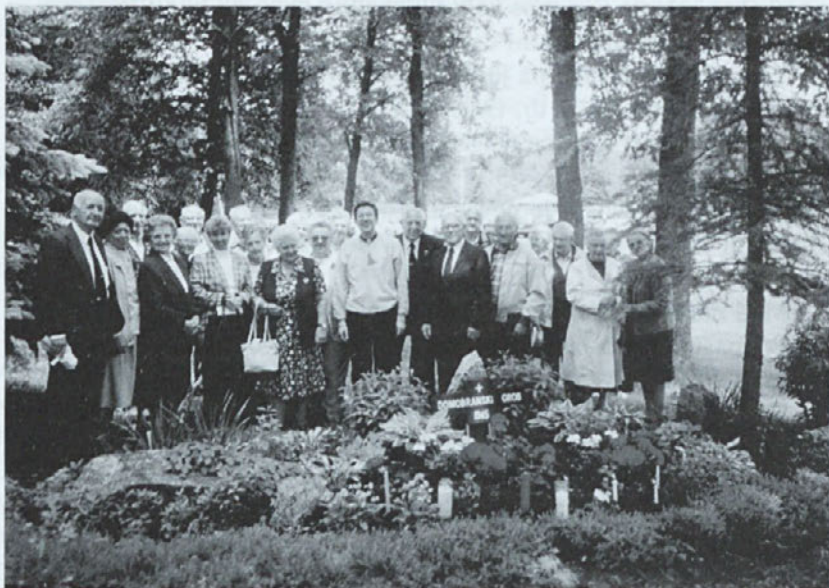
Park »Triglav« v Milwaukee - Odbor in prijatelji ob domobranskem grobu.