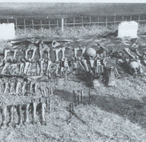
Posmrtni ostanki z Zgornje Hudinje

premalo, kjer pa se je vendarle nekaj naredilo, so pa zaslužni posamezniki, posamezne skupine, lokalne skupnosti ali Dars, ki avtocest ni mogel graditi čez grobišča (npr. Tezenski gozd.)