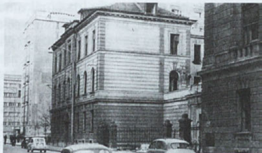
Še en posnetek sodnih zaporov na Miklošičevi ulici v Ljubljani

Otožno kimaš, hrepenenje mladosti ne privabi več; preč je srca veselje, preč ljubezen, zgrešil si življenje.