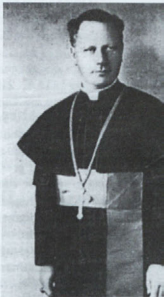
Podobica v spomin na petdeseti rojstni dan škofa dr. Gregorija Rožmana leta 1933.

V svojih pridigah je dosledno govoril o obsodbi komunističnih zločinov in protipravnega nasilja, ne pa o boju proti Osvobodilni fronti, proti