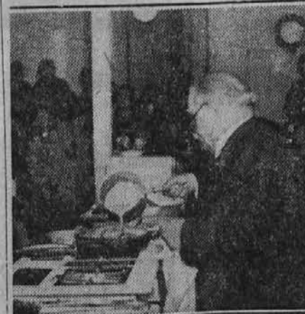
Kralj pariških kuharjev razkazuje svojo umetnost veliki skupini radovednih gledalk.

Raztepi štiri rumenjake ter jim primešaj za 4 jajca težine sirovega masla, prav toliko sladkorja in moke. Iz beljaka napravi sneg in ga rahlo primešaj prejšnji zmesi. Deni vdobro namazan pekač in po vrhu sadje po okusu, katero potrosiš s sladkorno sipo. Ko je kolač pečen, ga vnovič potrosiš s sladkorjem.