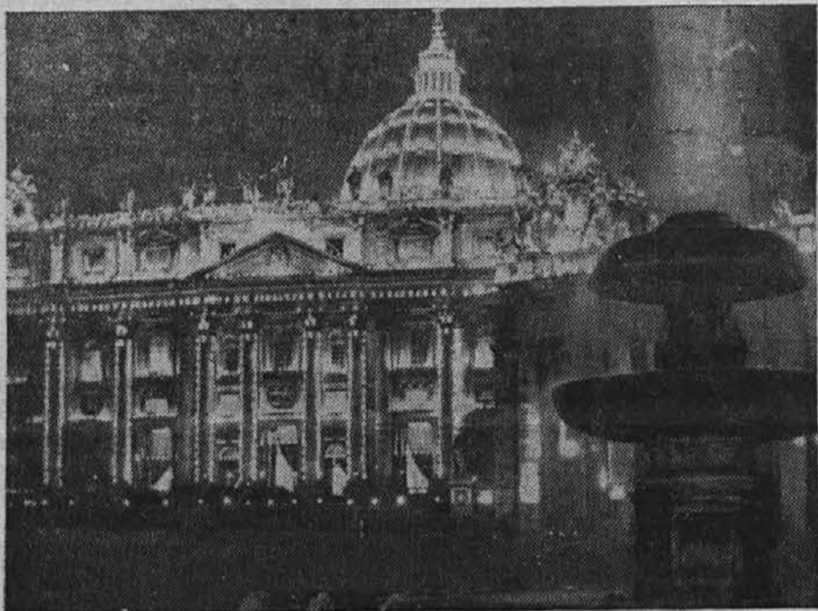
Krasno razsvetljena cerkev sv. Petra v Rimu