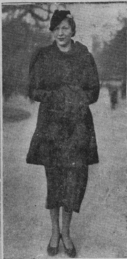
Zimska moda v Evropi: obleka za mrzle dni.

Otrok vprašuje več, nego more deset mater ali očetov odgovoriti. Pretirana je zahteva nekaterih vzgojiteljev, da je treba na vsako otroško vprašanje odgovoriti. Res pa je, da odgovarjaj na vprašanja ki izvirajo iz otroškega resničnega zanimanja in iz istintne želje, da bi se o čem poučil. Toda vsak otroški "zakaj" nima globokega ali resnega izvora. Često smo priče, ko gre mati z otrokom po cesti ali se vozi na železnici in otrok jo neprestano vprašuje; mati je očitno utrujena, vendar z angelsko potrpežljivostjo odgovarja na vsaka otroško vprašanje. Mati ni zaključila niti svoje- ga stavka, ko jo otrok prekine že z novim "zakaj". Končno slišimo nevoljno mater vzklikniti: „Ali otrok, nikar ne izprašuj tako neumno!“ Pri tem si mislimo: Tako bi bila mati lahko pred pol ure odgovorila, saj otrok ne izprašuje iz želje po pouku in globljem pojasnjevanju, nego le zato, da se zabava, in da mu materno govorjenje preganja dolg čas. Ako bi mati otroka zdaj ponovno vprašala vse tisto, kar mu je pravkar razložila, bi se prepričala, da si ni otrok zapomnil niti enega njenega odgovora in da je brzčas sploh ni poslušal. Žrtev utrujene matere je bila torej z odgovarjanjem čisto brez koristi. O- troka je le razvadila, da brezmiselno