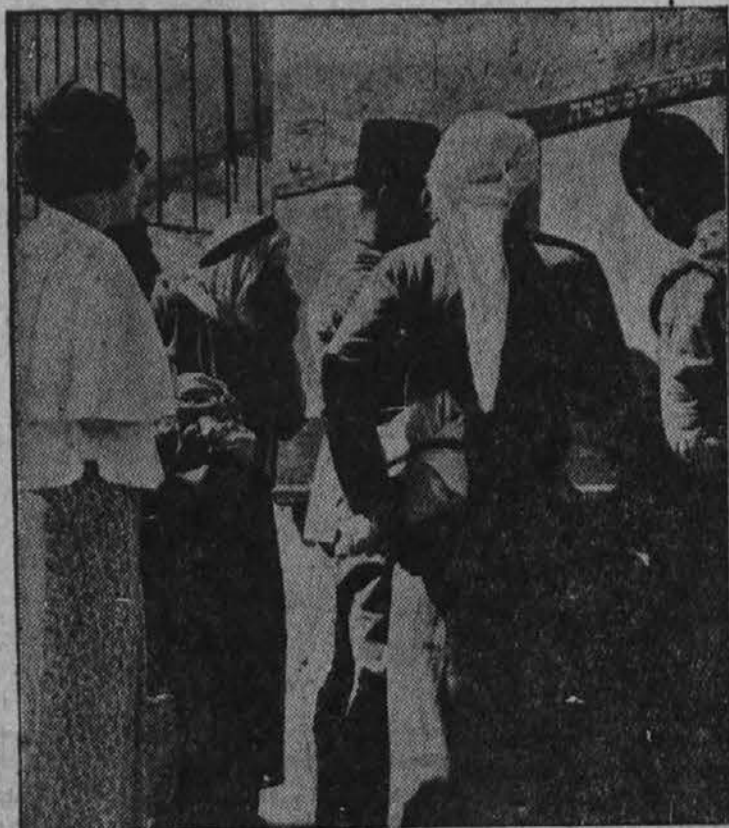
Nemiri v Palestini: Radi preganjanja židov v Nemčiji je postal pritok židov v zadnjih mesecih zelo velik, kar je povzročilo protestne demonstracije tamkaj živečih Arabcev. Ljudje čitajo razglas angleških oblastev.