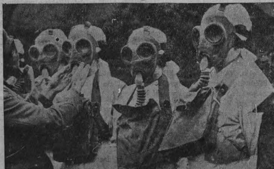
Na Angdeškem se pripravljajo za bodočo vojno. Bolniške strežnice se pripravljajo z upravljanjem mask proti plinom.

Ob nedeljah in praznikih od 10. do 12. ure.