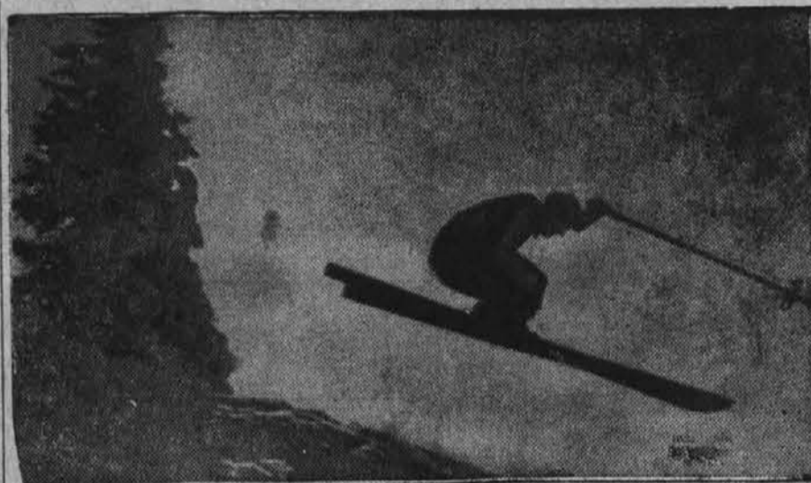
Zimski sport cvete sedaj v Evropi: Smučar v skoku.

Lahi se boje kukavice ljubljanske radio oddajne postaje kot hudič križa. Strogo pazijo, da ne pride po zraku kaka beseda iz Jugoslavije, ki bi vtila poguma. Svoj strah pred slovensko poštno besedo kažejo s izjavami, ki jih mora vsak lastnik posameznih lokalov podpisati, da mu dovolijo namestiti v lokal radioaparata. Vsak gostilničar se mora pismeno obvezati, da ne bo sprejemal s svojim aparatom ne govorov, ne predavanj in tudi petja ne, ki ga oddaja slovenska postaja. Edino godba se lahko brez "nevarnosti za državo" sprejema.