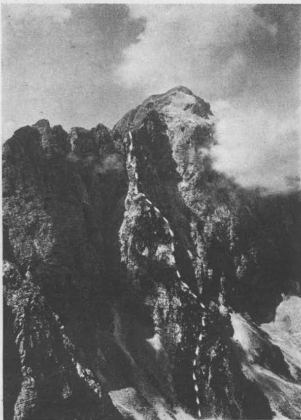
Mangrt z Rateških Ponc