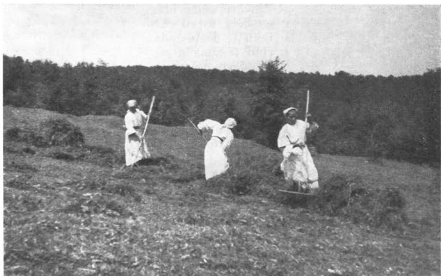
Ob košnji na Gorjancih