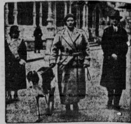
Jugoslovanska kraljica Marija v Karlovih varh.