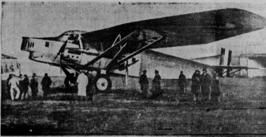
Orjaško bombno letalo tipa Farman, katerega krila merijo 36 metrov in ki lahko leti 4000 kilometrov daleč v sovražno četelo. S seboj lahko vzame poldrugo tona bomb. Leti pa z brzino 200 km na uro.

Šavnatelj berlinskega živalskega vrta, dr. Lutz Heck, je napisal izredno knjigo iz svoje afriške ekspedicije, kjer je lovil najraznovrstnejše živali za svoj vrt. V tej knjigi je namreč točen opis vseh živalskih glasov, zraven pa je pridejana plošča, ki te glasove v vsej resničnosti podaja. Bralce čita in sliši — džunglo.