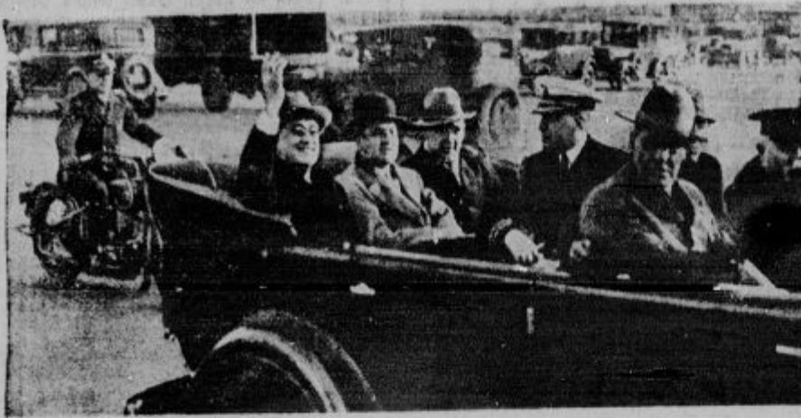
Roosevelt obiskal Hooverja. Prvikrat v zgodovini severno-ameriške Unije se je zgodilo, da je njen predsednik povabil k sebi svojega že izvoljenega naslednika na razgovor o vseh važnih tekočih vprašanjih. Hoover je svojega zmagovalnega nasprotnika Roosevelta sprejel v Beli hiši, da bi se razgovarjal z njim o vprašanju dolgov. — Slika: Roosevelta pozdravljajo pristaki pred Belo hišo.