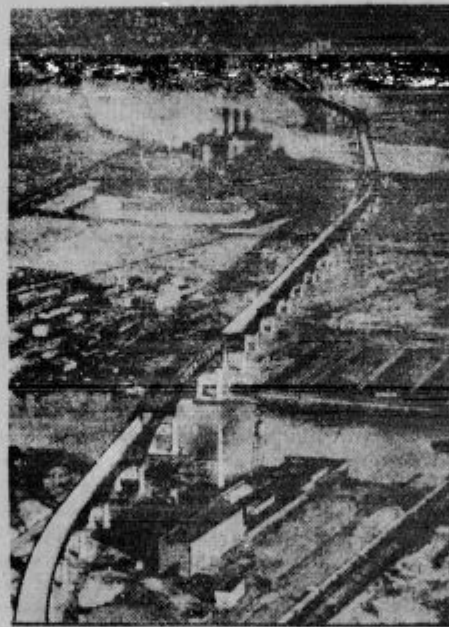
Največja avtomobilska cesta, ki veže dve ameriški mesti Jersey City in Newark z vijaduktom (spodaj reka Passaic). Ta cesta ne stane nič manj kot 1.428.000.000 dinarjev. Ima izreden prometni pomen, ker ležita obe mesti blizu Newyorka.