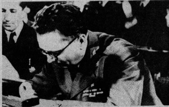
Maršal Tito podpisuje akt o razglasitvi Federativne ljudske republike Jugoslavije