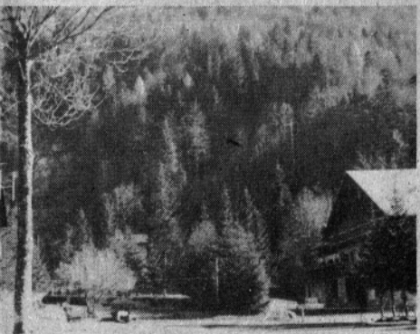
ka res obsojena na takšnote samevanje?