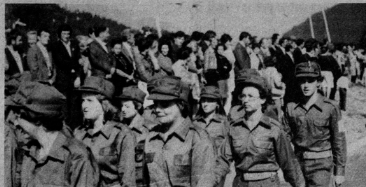
Mladinci prostovoljci – uspešno sodelovanje z njimi in vir kadrov obenem

večina rezervnih starešin, nekatere strelske organizacije, kot so Solčava in Luče, pa starešine tudi vodijo. Poleg teh in ostalih nalog so prvi v občini in hkrati najbolj odločno krenili v akcijo