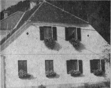
spših primerov obnavljanja kmetij v njihovem slogu