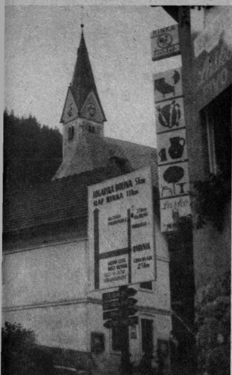
tole vse res . . .