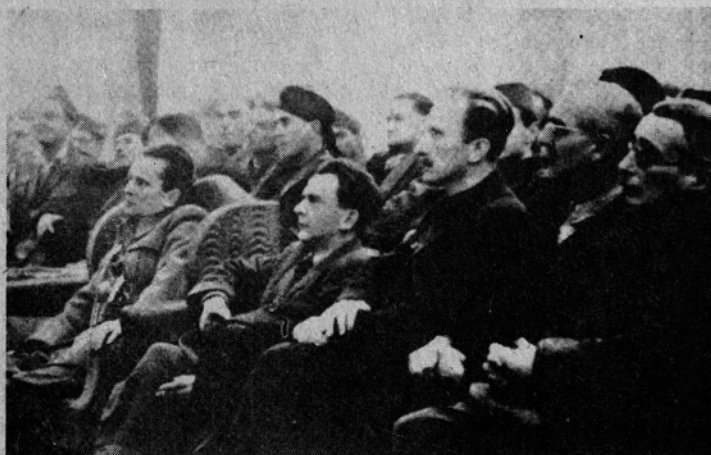
Na II. zasedanju AVNOJ, 29. novembra 1943

čestitajo vsem delovnim ljudem in občanom ob dnevu republike