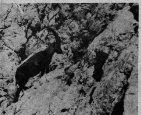
jegovu kraljestvo se splača podati