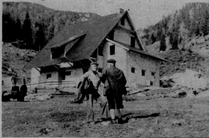
Majhna zamenjava. Tokrat posnetek sadov izjemnih naporov lučkih planincev, prihodnjic več besed o njih in slika laže dostopnega bivaka na Travniku.

porabili svojih skromnih 9.000 dinarjev. V letošnjem letu jim je, priskočila na pomoč temeljna