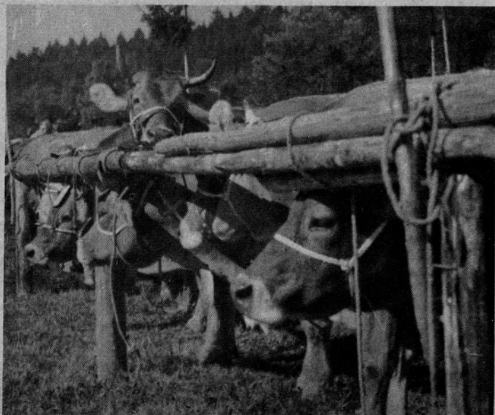
Na ocenjevanje čakajo nekatere spokojno, druge pa dokaj nepotrpežljivo

Udeležba in na koncu izpolnjena anketa sta pokazali, da sta zanimanje in interes za takšne in podobne seminarje dovolj velika. Udeleženci so izrazili tudi željo po enodnevnih seminarjih in po takšnih predavateljih, ki bi teorijo čim bolj povezali s prakso. Izoblikovalo se je tudi mnenje, da bi podobne seminarje veljalo pripraviti tudi v okviru organizacije združenega dela.