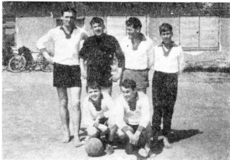
NOGOMETASI ZG. ROČICE — Tudi v Zgornji Ročici imajo svojo nogometno reprezentanco, ki tekmuje z moštvom iz Zg. Ščavnice. Tekmovanja prirejajo ob lepih nedeljah. Trener moštva iz Ročice je Franc Fišer, učitelj iz Lokavca. Na fotografiji vidite del nogometišev iz Zg. Ročice.

ki bi napravili prvi korak pri organiziranju in ustanavljanju telesno vzgojnih društev. Prva pobuda bi morala izvirati od občinske zveze za telesno vzgojo, krajevnih organizacij socialistične zveze in drugih družbeno političnih organizacij. S tesnejšo povezavo med njimi bi tudi napredoval razvoj telesne vzgoje v občini Lenart.