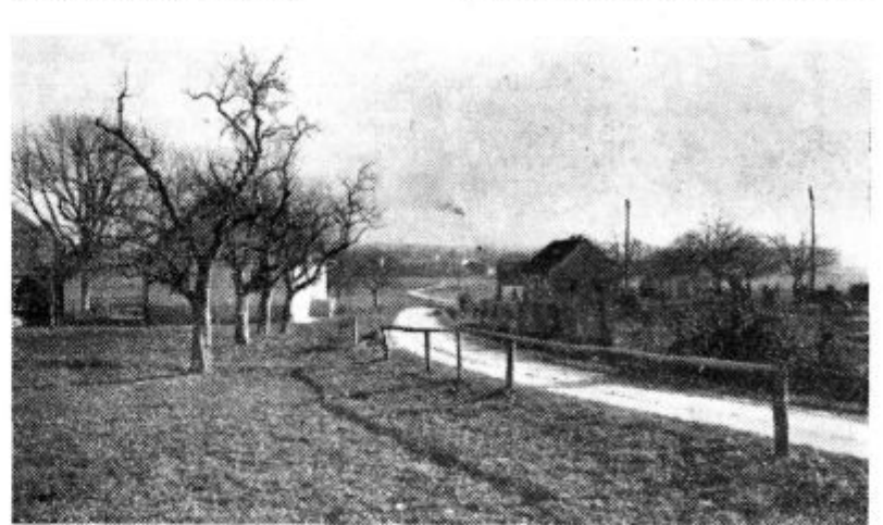
Na fotografiji: Na koncu Usnjarske ceste v Lenartu uspešno posluje usnjarski kombinat.

stotkov kvalificiranih, medtem, ko so vsi ostali nekvalificirani in polkvalificirani delavci.