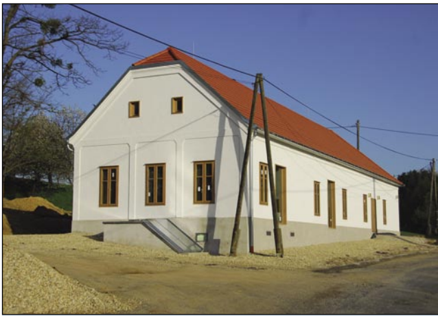
V Andovcih bo v tej obnovljeni stavbi čajna hiša

Vse to si sicer težko predstavljamo brez sodelovanja prebivalcev na obravnavanem območju.