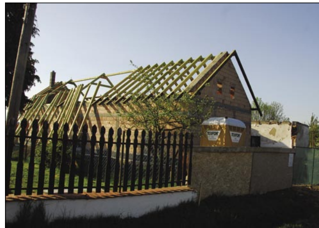
Investicija v Števanovcih