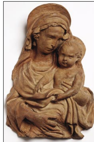
Lorenzo Ghiberti, glineni relief Marija z otrokom, 15. st.

primer za shranjevanje vode, go- jenje bonsajev, mediteranskega rastlinja, zdravnih zelišč in za- čimb. Glino lahko strokovnjaki