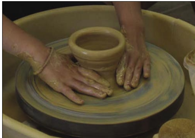
Izdelava glinene posode

z drugo besedo terakote je do- volj skrivnostna in upravičeno rečeno večna, da nas pritegne. Mokra, temna, siva gmota se je s spretnostjo, znanjem in do- mišljijo v ognju že od nekdanj spreminjala v oblike opojnih tekstur. Iz nje so ljudje v visokih kulturah starega sveta izdelovali predmete, ki si jih danes lahko ogledujemo v številnih sveto- vnihih muzejih.