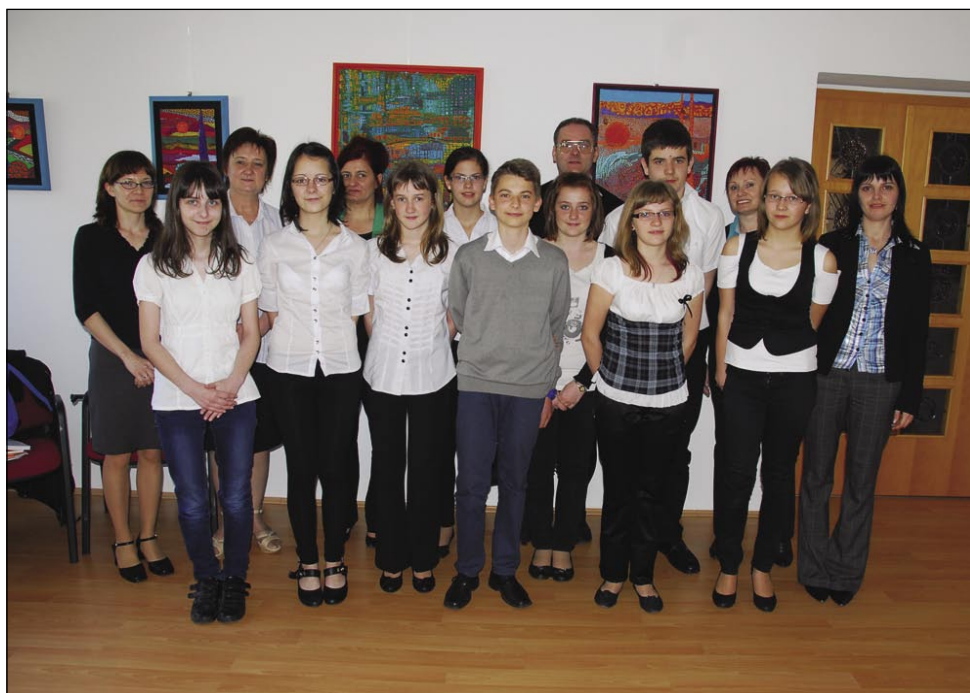
Vsi učenci, učitelja in člani komisije po opravljenem tekmovanju