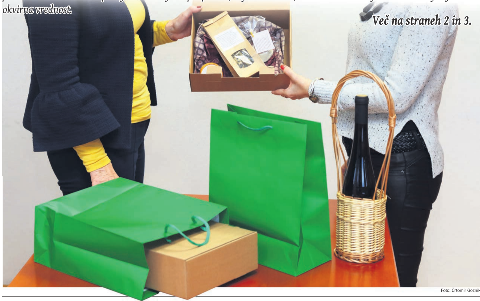
Več na straneh 2 in 3.

Poslovna darila ob koncu leta so že ustaljena dolgoletna praksa predvsem v gospodarstvu, pa tudi v javni upravi. Primer- no izbrana darila postajajo vedno bolj tudi del predstavljanja in trženja lastne kulture. Tokrat smo pod drobnogled vzeli poslovna darila občin v Spodnjem Podravju in povprašali, kaj bo v darilih, komu bodo namenjena in kakšna je njihova okvirna vrednost.