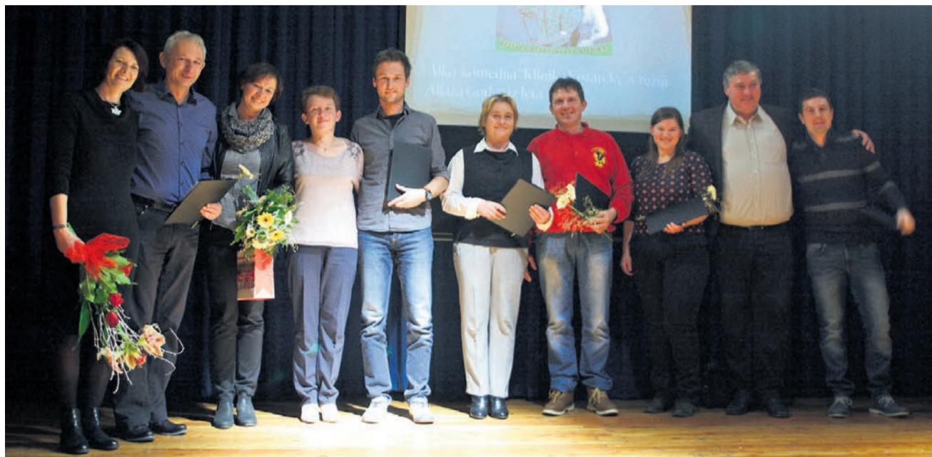
S praznovanja KD Draženci in Šus teatra