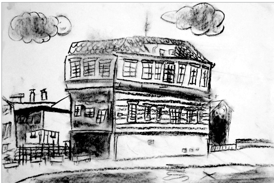
Slika 1: Deček A (9 let). Risba z ogljem.

ni likovni strukturi vidni impulzivnost in ekspresivnost v likovnem izrazu. Učenec je pri risanju uporabljal izjemno bogate in raznovrstne likovne ideje ter kombiniral tehnične postopke, ki mu jih je omogočalo izbrano risalo. To kaže na učenčeve dobre likovne izkušnje. Skladnost likovnega dela je dobra, ritmiziranje temnih in svetlih površin pa kaže na razvit likovni občutek. Nakazovanje prostora z uporabo različnih prostorskih ključev kaže na učenčeve izjemno razvite spacialne sposobnosti, odločnost potez pa pripomore k sugestivnosti likovnega izraza. Po analizi likovnega dela učenca lahko ugotovimo, da so na njegovem izdelku vidni mnogi znaki ustvarjalnosti in likovne nadarjenosti.