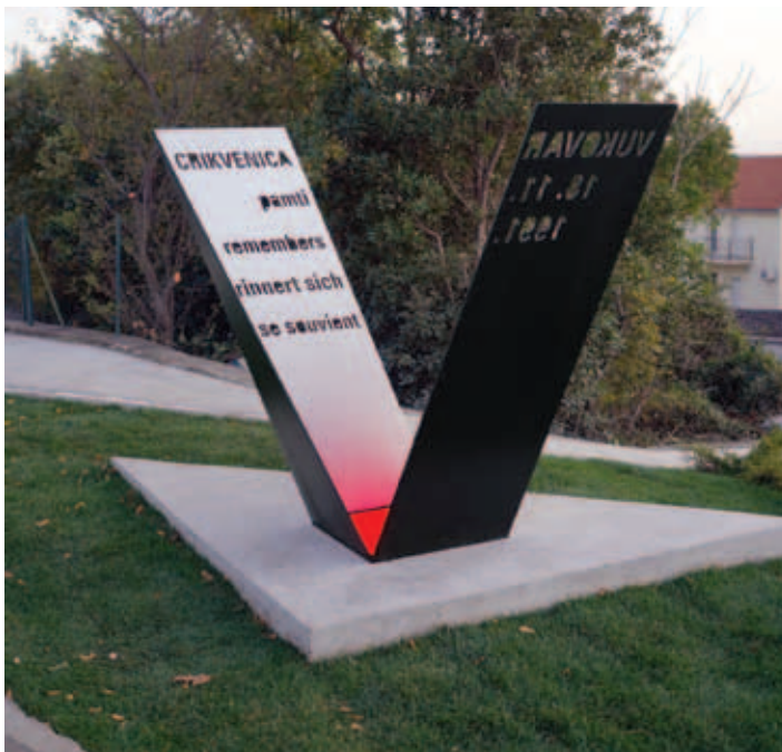
Skulptura Večni ogenj za trajno povezanost prijateljskih mest

Na skulpturi, veliki meter in pol, prevladuje oblika črke V, ki simbolizira začetnico naziva mesta Vukovar in Victory, zmago. Na obeh straneh črke V sta vrezani besedili, in sicer na eni Vukovar 18. 11. 1991 in na drugi Crikvenica pomni (s prevodom v angleščino, nemščino in francoščino). Ogenj simbolizira svetleči pravokotnik, ki je obenem tudi oznaka državnosti. Večni ogenj simbolizira trajno ohranitev hvaležnega spomina na