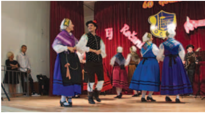
S pesmijo in plesom je življenje lepše