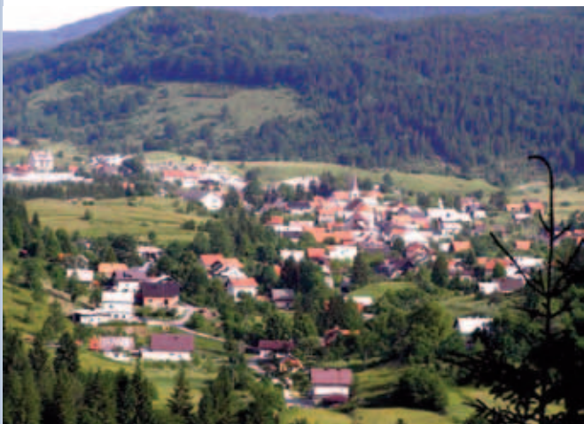
Prezid, foto: www.cabar.hr