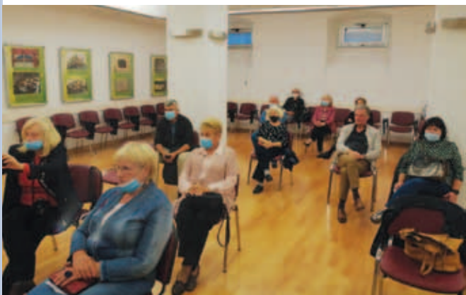
S predstavitev v SKD Istra v Pulju