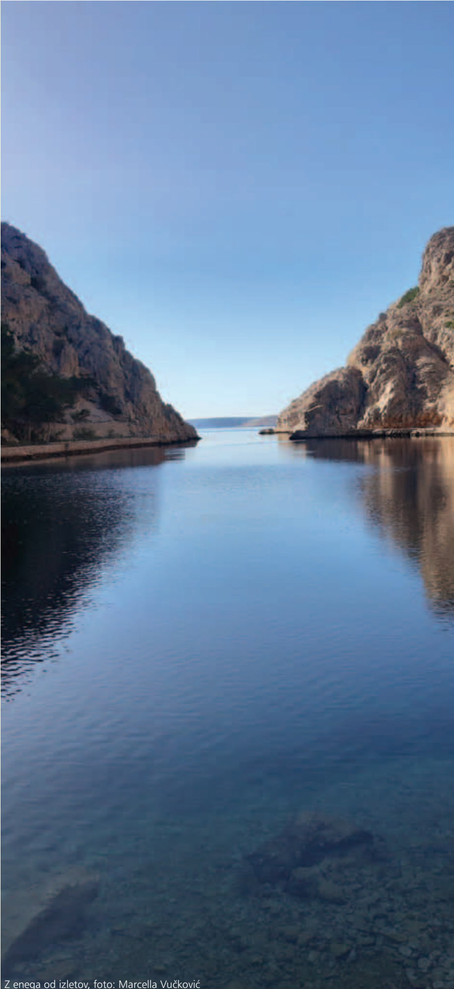
Z enega od izletov

Covid je konec leta ponovno pritisnil. Na tisoče obolelih, tudi med člani Bazovice, na stotine in tisoče umrlih na Hrvaškem, v Sloveniji, v celi Evropi. Zaprte meje, najprej med državami, potem tudi med kraji, zaprti lokali in gostilne. Tudi PS je počasi zaprla svoje družabno delovanje. Nič sestankov, razstav, predavanj, skupnih izletov. Depresija. Dnevi so vse krajši, temačnejši, z veliko oblakov, dežja, vlage. Občasni telefonski pogovori ali elektronska pošta, in to je vse od stikov. Siva in vlažna megla se je zavlekle v naše duše, strah, nezaupanje v bližnjega. Naključni stiki z okuženimi rezultirajo s samoizolacijo, še svojih bližnjih si ne upaš obiskati. A čas vseeno hitro teče, tokrat mimo tebe.