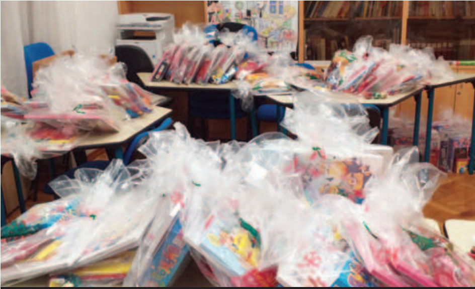
Miklavževanje na daljavo

14.–24. december, Slovenski dom KPD Bazovica