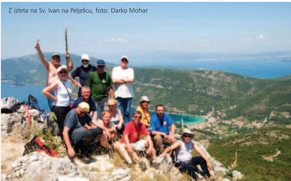
Z izleta na Sv. Ivan na Pelješcu

društva Elektra iz Požege (vsi so tudi člani tamkajšnjega HPD Sokolovac, op. avtorja). Zato so v prekratnem dvodnevem obisku lahko videli najlepše dele te prelepe gore. Povzpeli so se mimo Veličkega gradu na Lapjak, kontrolno točko hrvaške planinske obhodnice, na Nevoljašu doživeli tisto, drugod že zdavnaj izumrlo prvotno planinstvo "ob ognju", se sprehodili skozi prelepe gozdove in ob hitri reki Dubočanki zvečer zaplesali v Veliki, obiskali Jankovac z dvojnimi jezerom, Grofovo učno stezo in slapom Skakavac, najlepšim delčkom slavonskih hribov. Iz prvega, slučajnega srečanja se je tako razvilo lepo prijateljstvo. Zato so že v na-