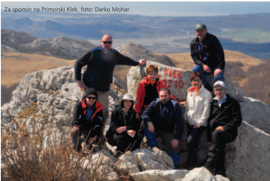
Za spomin na Primorski Klek, foto: Darko Mohar

(ne)kuhana jajca (?), sladoled, pijača, slana voda (nekateri to imenujejo tudi morje), (navadna) voda (morda samo v kakšnem kolenu), "gori-doli" planinarjenje, sprehodi, plavanje, sončenje itd. Resnično smo se imeli (pre)lepo!