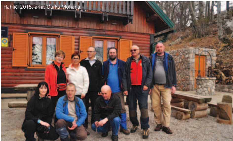
Hahličji 2015, arhiv Darka Moharja.

■ Kronološki zapis za Bazovico in Sopotja (priloga Ustvarjalni covid) prispeval Tomislav pl. Garilović (pl.: planinec, op. avtorja).