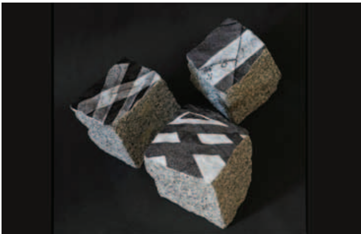
Nagrajena fotografija, foto: Istog Žorž

Tretja razstava malega formata v organizaciji Hrvaškega društva likovnih umetnikov (HDLU) je v galeriji Juraj Klovič predstavila umetniška dela članov tega društva in študentov reške Akademije za uporabne umetnosti. Na ogled so bila dela, ustvarjena v različnem likovnem delovanju, edini pogoj za sodelovanje pa je bila velikost, ki ni smela presežati 15 cm oziro-