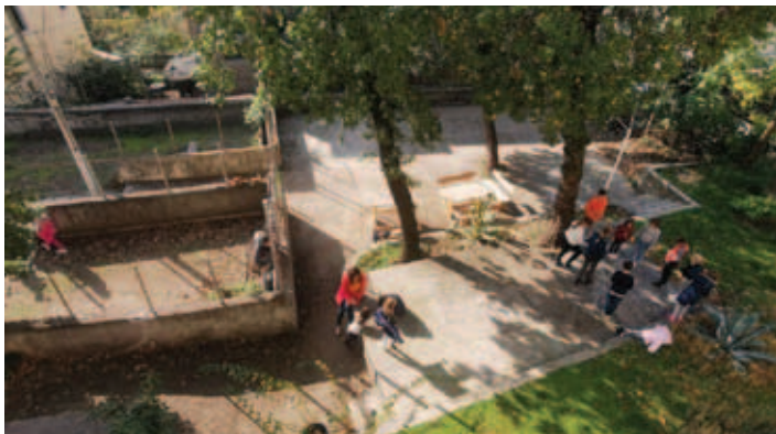
Jesen v Bazovici tudi na vrtu Slovenskega doma, foto: Saša Kernjak Zubović

ukrepov in priporočil. Po zajtrku so risali, brali, izdelovali voščilnice za božične in novoletne praznike, izkopavali dinozavre ter se ob vsem učili slovenskih besed, po kosilu pa si ogledali tudi kakšen film ali risanke. Po besedah učiteljic se otroci med seboj v glavnem že poznajo z drugih srečanj v KPD Bazovici, nastala so tudi nova prijateljstva in nasploh so bili izjemno pridni. K temu je med drugim gotovo pripomoglo tudi lepo, sončno in toplo vreme, v katerem so lahko brezskrbno uživali v igri in veselju na prostem, v velikem in urejenem vrtu Slovenskega doma.