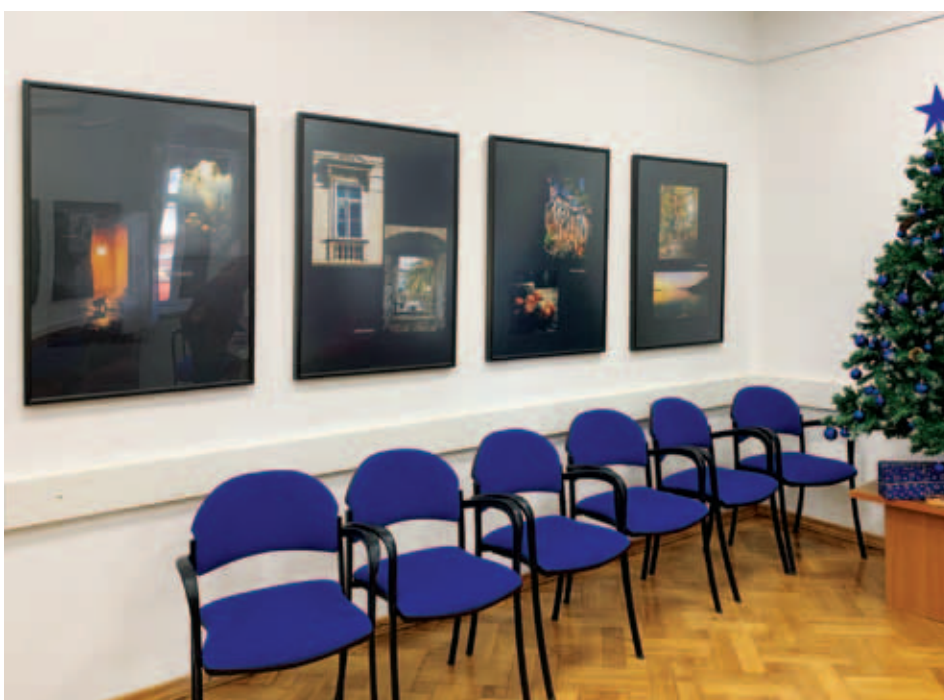
Sedeži čakajo obiskovalce, foto: Marjana Mirković

zneje z družino preselila na Hrvaško. V zadnjih letih je odkrila tudi ljubezen do fotografije. Na svojih posnetkih želi ujeti trenutke in jih ohraniti, kot so bili doživeti ali videni, včasih skuša pozornost nameniti stvarim, ki so mimoidočim v vsakdanji naglici pogosto prezrte. Rada se poigra tudi s svetlobo in sencami, a večni navdih ji ostaja neizmerna lepota narave.