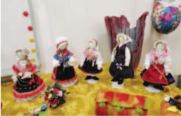
Delo pridnih rok

V okviru sodelovanja zlasti z bližnjimi slovenskimi društvi je KPD Bazovica gostila SKD Snežnik iz Lovrana na razstavi ročnih del, pred tem postavljeno na ogled 18. septembra v Lovranu. V programu z naslovom Izmenjujmo veščine so na srečanju ustvarjalnih delavnic poleg lovranskega sodelovala tudi društva KPD Slovenski dom v Zagrebu, SKD Istra v Pulju, SKD Oljka v Poreču in SKD Gorski kotar v Prezidu.