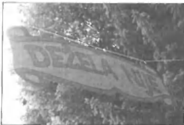
Dobrodošli v deželi Nije

ogledati to čudovito deželo brez odraslih in brez pravil. Vendar pa v deželi Nije ni vse tako rožnato, kajti v zalivu nedaleč stran je zasedrana ladja zlobnega kapitana Kljuko, ki ima s Petrom še nekaj