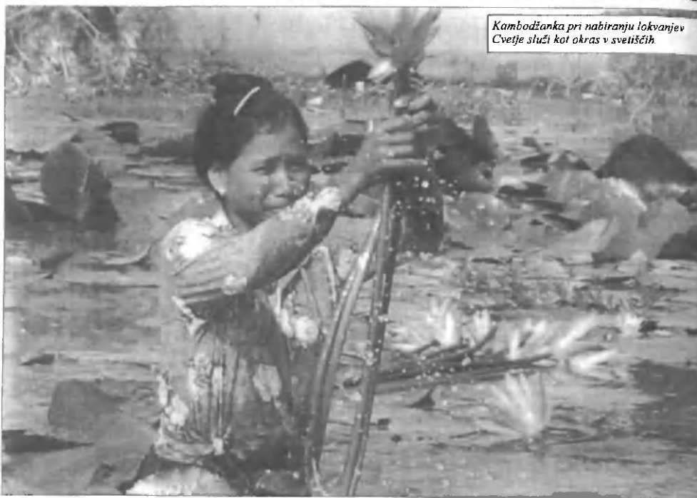
Kambodžanka pri nabiranju lotusov. Cvetje služi kot okras v svetiščih.

lice polnili s »sticky« rižem, kuhanim v kokosovem mleku in posutim z drobnimi črnimi fižolčki. To je priljubljen zajtrk Kambodžanov, čeprav jih veliko zajtrkuje tudi juho in kuhan riž. Nato smo jo mahnila na plantažo guave, kjer smo, tako kot domačini ob prostih dnevih, počivali v visečih mrežah v senci guavinih dreves, jedli sadje in klepetali. Klepetali o različnih stvareh, predvsem pa o budizmu in o zgodovini te dežele, o zgodovini, ki je pustila globoke rane v srcih teh ljudi.