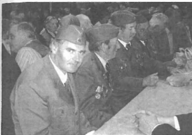
Nekateri borci so srečanje vzeli zares in se temu primerno tudi oblekli.