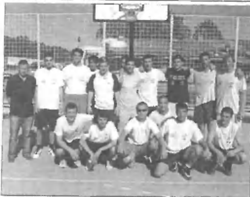
Trzinski igralci, ki so vztrajali do konca!