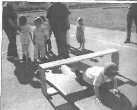
Saj veste - važno je sodelovati!