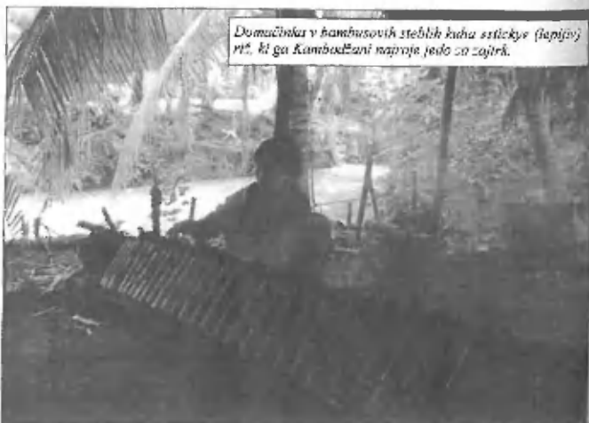
Domačinka v bambusovih steblih kupa stickyje (lepljive) riže, ki ga Kambodžani naproje jedo za zajtrk.

lepo sklada z modrino neba nad otočkom. Okoli hiš, ki stojijo ob poti, ki se vije čez otok, je bilo polno nasadov bananinih palm, pomelovcev in riževih polj, na katerih so kmetje z volovskimi vpregami obdelovali zemljo ali pa sadili riž. Nekaj pomelov sva celo narabotali in pojedli, po »grozodejstvu« pa sva se odpravili na neobljuden prostor tik ob