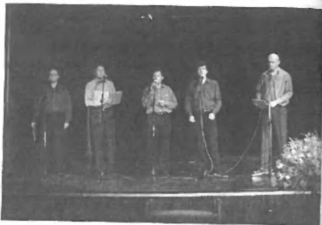
Pevski kvintet Vocalissimo