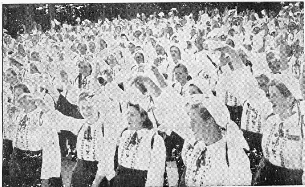
Časna tudeležba VDK pri odkritju kraljevega spova Ljubljani dne 6. IX. 1940.

Ničesar ti ne očitam, a rad mi boš verjel, da se marsikateri fant nekako izneveri svojemu domu. Da se pred brati in sestrami nekako prevzame. Posebno se to rado zgodi, če se fant, kakor pravimo, »osamosvoji«. Ni treba, da bi se že poročil. Dovolj