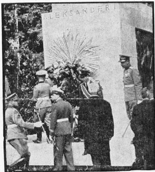
Kralj Peter II. polaga venec ob spomenik njegovega očeta.

Telesne vaje se bore proti zločinu in nemorali, saj to dvoje izvira le iz brezdelja in slabe družbe.