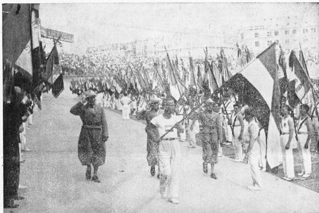
Častni obhodi. Naši tekmovalci v Franciji.