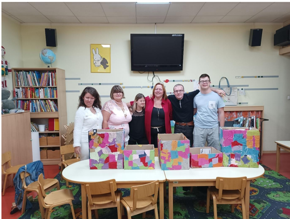
Slika 9: Bralno srečanje in ustvarjalna delavnica, na kateri smo krasili škatle za knjižnico semen v Knjižnici Ihan.