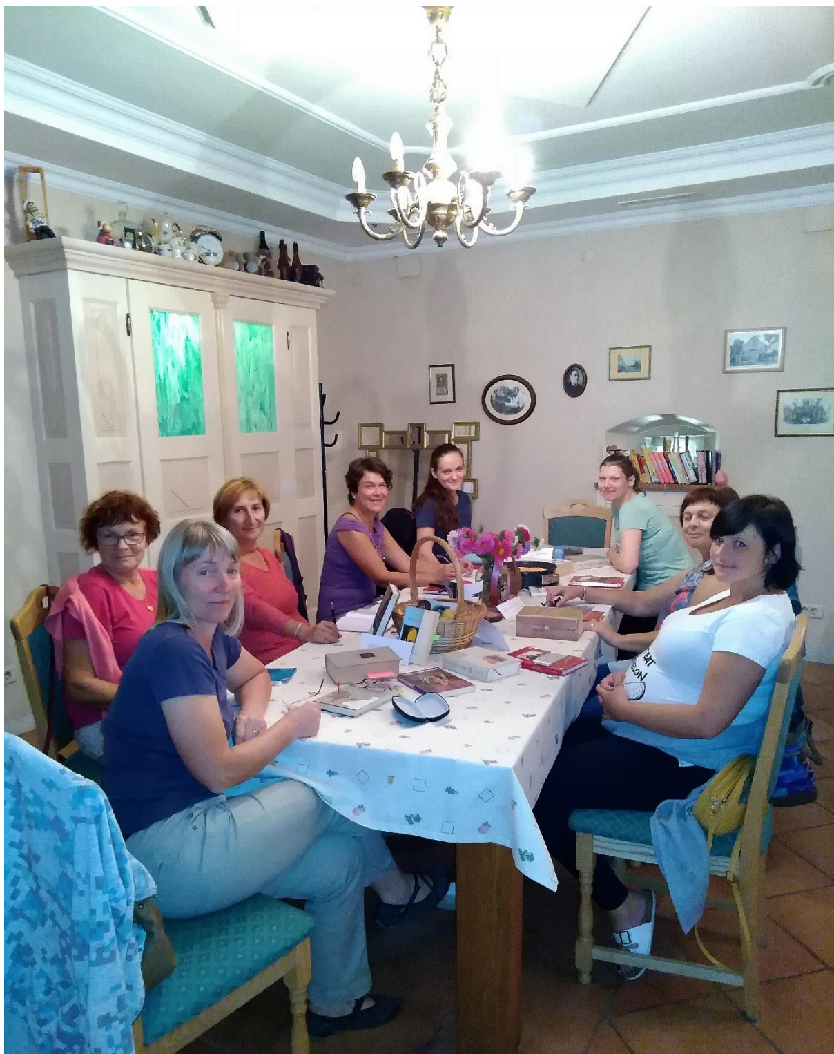
Slika 19: Bralke bralnega kluba Bralne lučke na srečanju v Detelovi sobi v Moravčah.