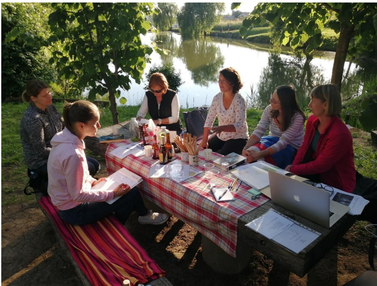
Slika 20: Bralke bralnega kluba Bralne lučke na zaključnem srečanju sezone pri Ribiški koči v Moravčah.