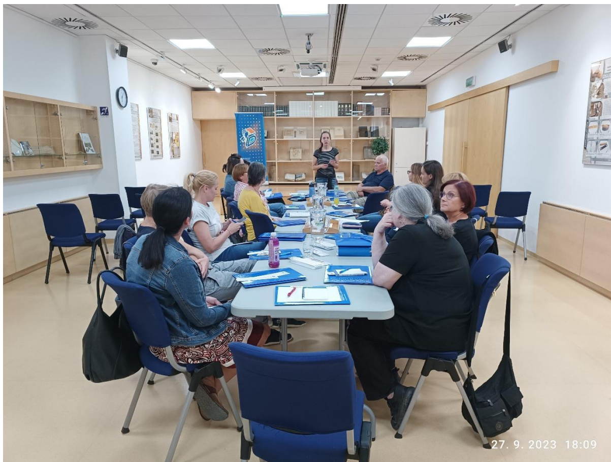
Slika 1: Seminar za moderatorje bralnih klubov (oktober 2023).

vodenjem. Izmenjamo si tudi bralne izkušnje in si svetujemo knjige v branje. Skupaj načrtujemo različne dogodke.