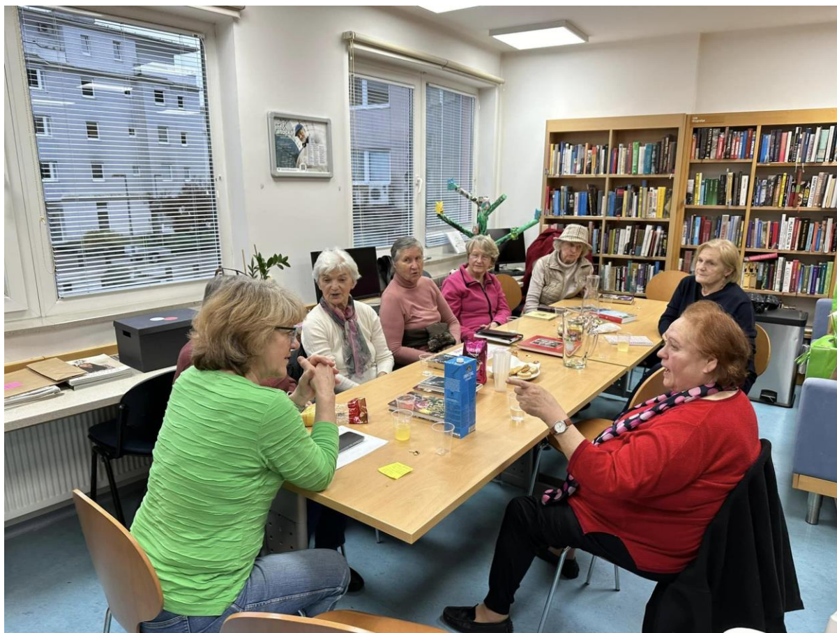
Slika 24: Srečanje bralnega kluba Knjižni klepet.