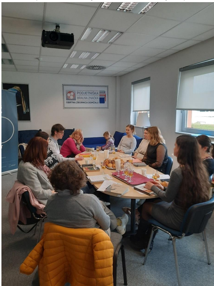
Slika 5: Spletna stran Knjižnice Domžale z objavo podkasta zaBOOKirano.