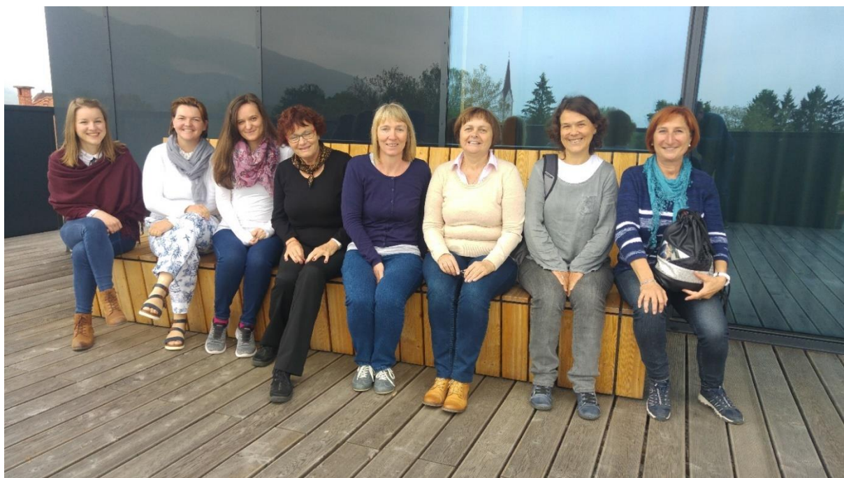
Slika 18: Bralke bralnega kluba Bralne lučke na ekskurziji v Radovljici.

Prav tako večkrat menjajo lokacijo srečanja. Najraje se s knjigo odpravijo k ribiški koči ob bližnjih ribnikih. Enkrat letno se odpravijo na ekskurzijo, katere glavna tema je eden izmed slovenskih avtorjev. Redno se udeležujejo skupnih dogodkov ob Noči knjige in zaključku sezone srečanj bralnih klubov.