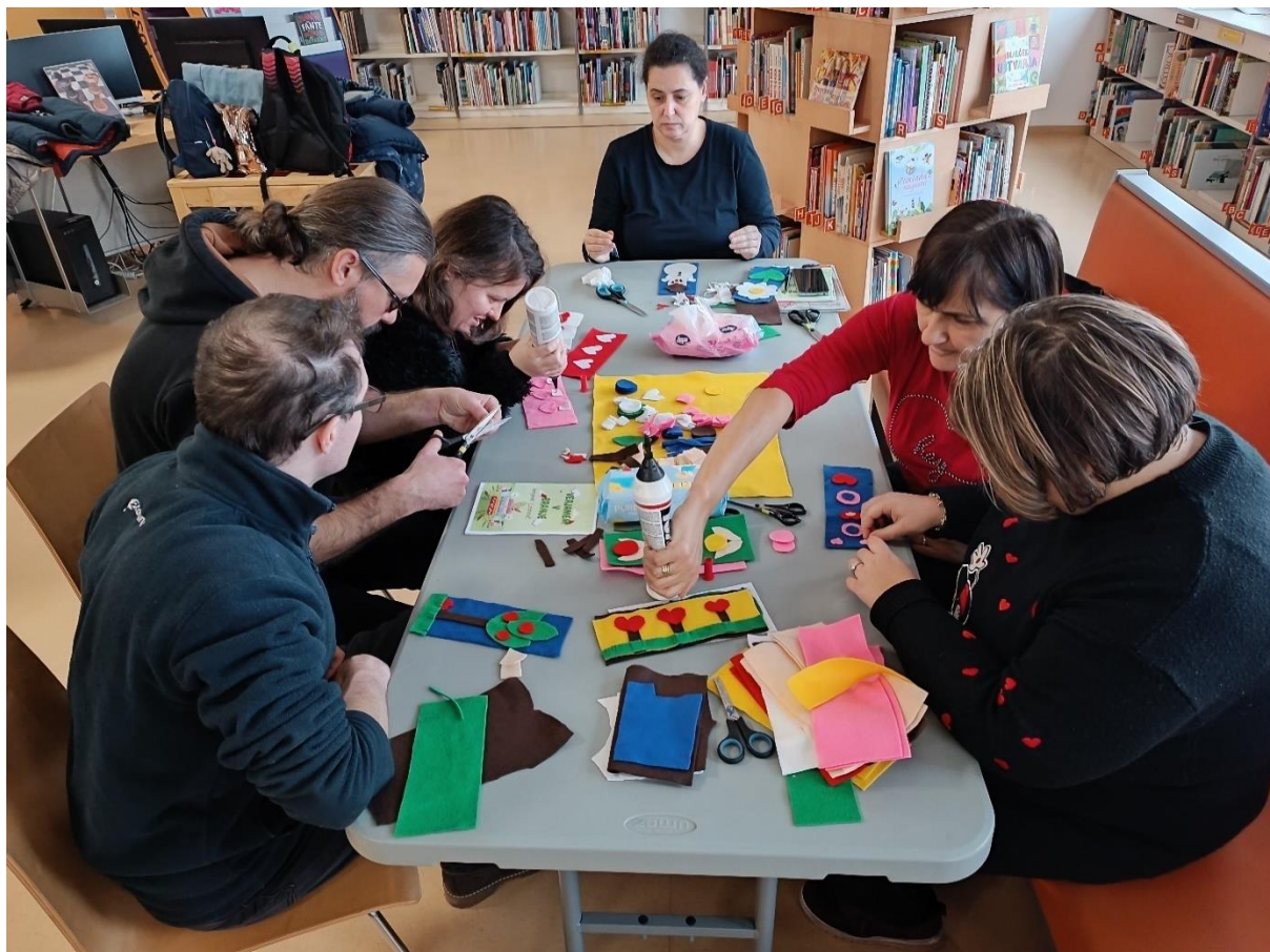
Slika 11: Ustvarjalna delavnica, na kateri smo ustvarjali knjižne kazalke.