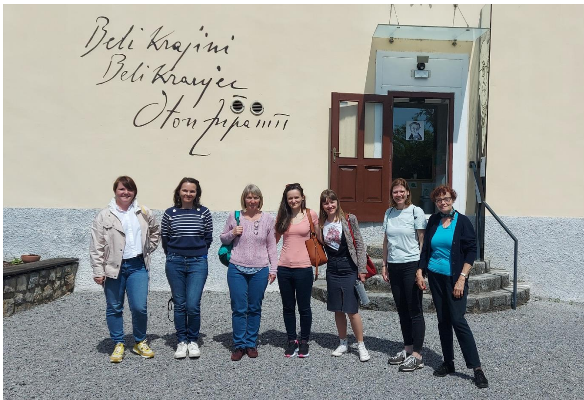
Slika 22: Bralke bralnega kluba Bralne lučke na ekskurziji na temo Otona Župančiča.