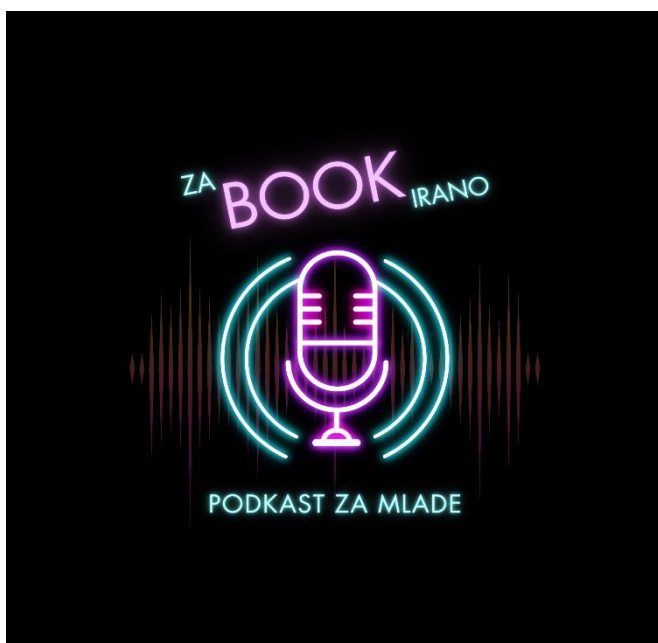
Slika 3: Logotip bralnega kluba otrok zaBOOKirano