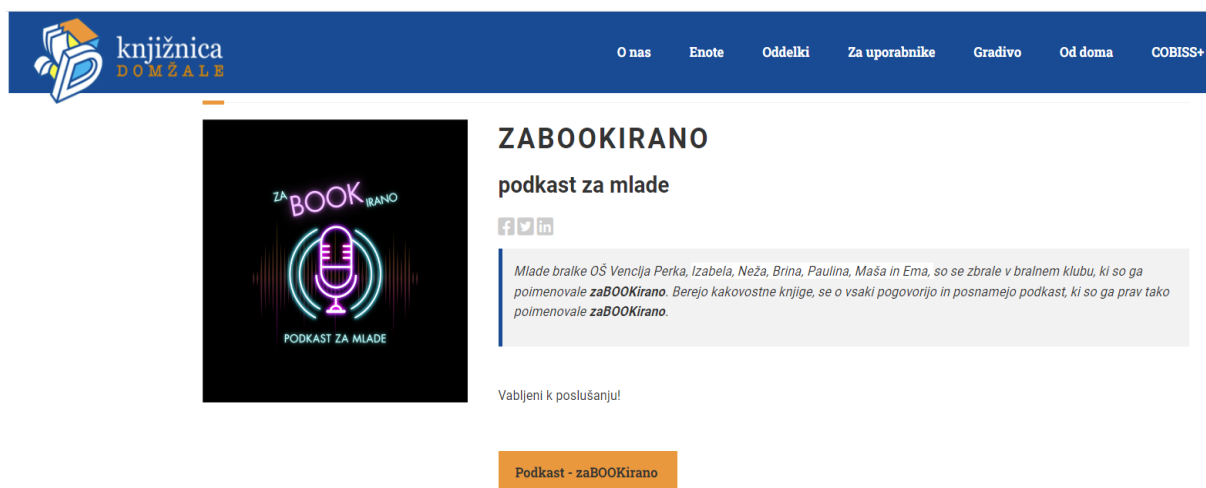
Slika 4: Spletna stran Knjižnice Domžale z objavo podkasta zaBOOKirano.