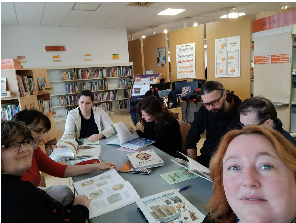
Slika 10: Bralno srečanje bralnega kluba Verjajem v knjigo.