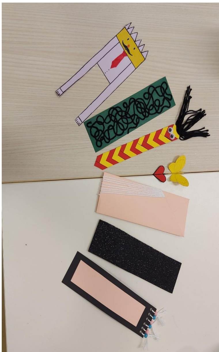
Slika 13: Ustvarjanje knjižnih kazalk.

Skupaj berejo predvsem knjige s tematiko odraščanja, (spletnega) nasilja, pomoči in solidarnosti, potovanj in duhovnosti ter psihologije. Mentorica načrtuje tudi skupne ogledе gledaliških ali kino predstav povezavi s knjigo, ki jo bodo brale. Marca bo organizirala ekskurzijo, če bodo našle ustrezen termin. Rade se udeležijo skupnih dogodkov ob koncu sezone srečanj bralnih klubov.