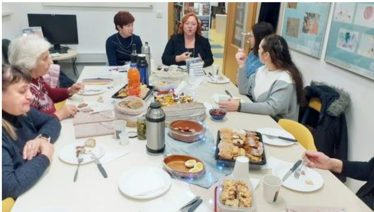
Slika 15: Praznično srečanje v decembru 2023.