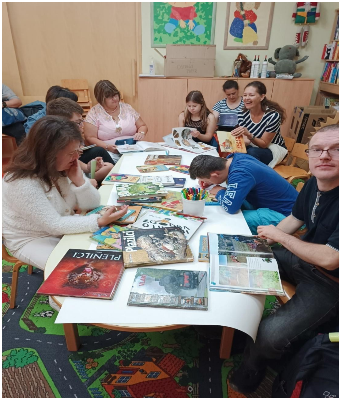
Slika 8: Bralno srečanje in ustvarjalna delavnica, na kateri smo krasili škatle za knjižnico semen v Knjižnici Ihan.