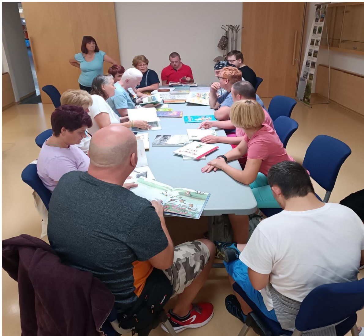
Slika 7: V sožitju s knjigo, 2023.