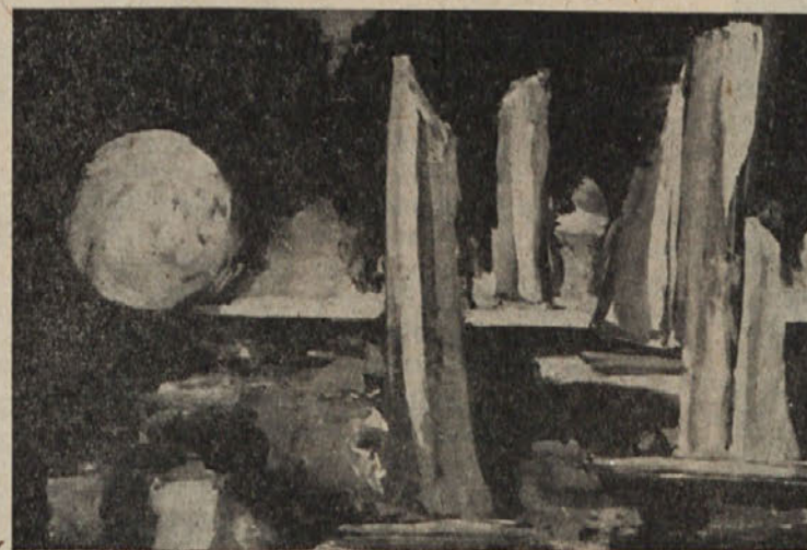
Iz »mladja 5«: Hubert Greiner, Celovec, »Luna v pristanišču« (tempera)

Odmevi na revijo, prevodi iz Saint-Johna Persa (Lev Detela) ter pravila kluba in odra zaključijo oblikovno in v bistvu tudi vsebinsko lepo uspelo revijo »mladje 5«.