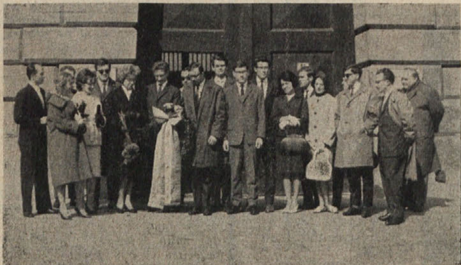
Člani Kluba slovenskih študentov na Dunaju, ki so položili venec na grob žrtev nacizma.

Zahtevajte cenike! Ugodni plačilni pogoji!