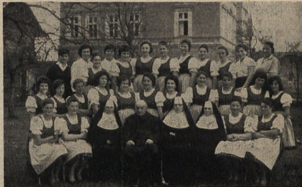
Gojenke gospodinjske šole v Št. Rupertu pri Velikovcu.