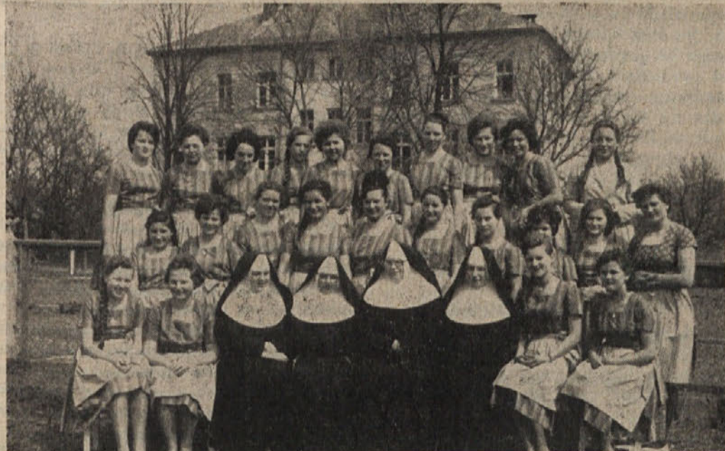
Gojenke gospodinjske šole v Št. Jakobu v Rožu pred svojo šolo.

čih narodnih vezenin, ki so bile izdelane skrbno in natančno. Dekleta, ki pridejo iz te šole, bodo znale z delom svojih rok obleči sebe, svoje otroke in deloma še može. O vsem tem so nas prepričali različni kosi perila in oblek. Računarski očetje so iz razstavljenih del lahko izračunali, koliko so si dekleta s temi deli prihranile izdatkov za življenje in krojače. In kako vesele so še gojenke same, ko s temi izdelki lastnih rok razveselijo svoje domače, okrasijo svoje domove in obogatijo svoje bale.