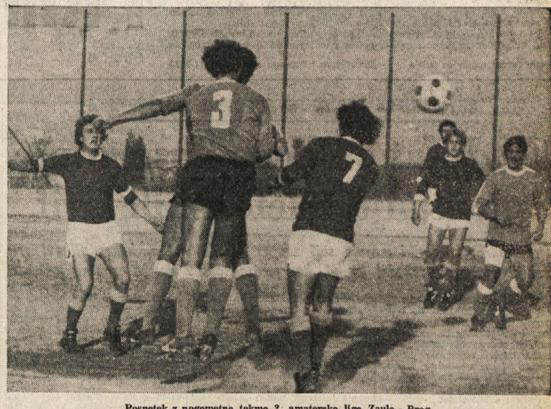
Posnetek z nogometne tekme 2. amaterske lige Zaule - Breg

Izdili 8. KOLA Villanova - Panzano 2:1 Azurra - Vermeghiano 2:1 San Lorenzo - Brazzanese 2:2 Azurra - Pro Farra 0:4 Mladost - Libertas Capriva 4:2 Fogliano - Piedimonte 2:1 Mariano - Isonzo 0:1 Sagrado - Poggio 0:0