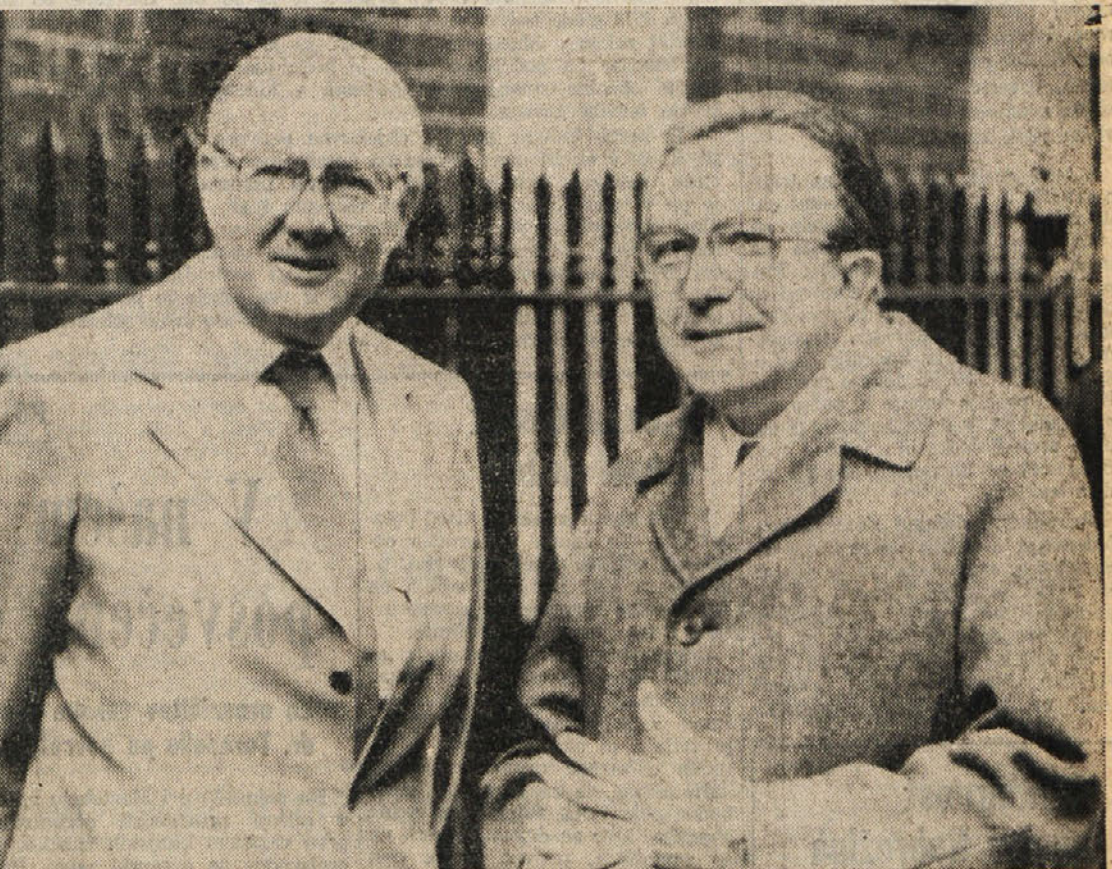
LONDON — Andreotti včeraj ni uspelo izbeževati od Callaghana u-