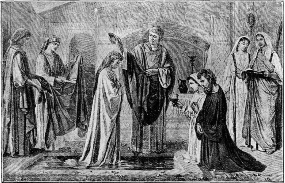
Krst prvih kristjanov

J e ni lepše družinske skupnosti, kot jo ima cerkvena občina. S kakšnim veseljem vleče človeka domača cerkev! Zunaj cerkve se ločijo pota posameznikov, vsak gre med tednom po lastnih opravilih in za lastnim dobičkom. Pa pride nedelja! Zvonovi pojo in vabijo vse v skupno očetovsko hišo, pred skupni oltar in k skupni družinski mizi. Vsi gledajo na isti tabernakelj, molijo istega dobrotnega Očeta, pojejo iste pesmi v čast skupni Materi. Vse karkoli je v hiši božji: oltar, obhajilna miza, krstni kamen spominja glasno in nazorno, da so vsi farani: premožni in ubožni, odrasli in otroci, bratje in sestre, sveta božja družina. In duhovnik v vasi? Kaj naj bo družega kot skupni oče, ki z ljubeznijo sprejema male. kot jih je spre-