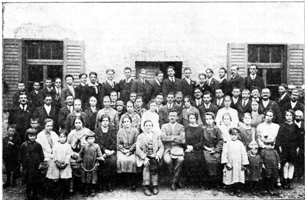
Vrhopoljsko društvo pred svojim domom

Nič čudnega ni, če se je v zadnjem času začelo po deželi novo gibanje za postavitev društvenih domov. Težko gospodarsko stališče, malomarnost in neorientiranost članov so glavne ovire, da ne zrastejo društveni domovi tam, kjer so sicer nujno potrebni in znabiti možni. Vemo dobro, da bo za uspešni razvoj društev in za udeležitev našega programa o večerni šoli nujno potrebno zidati take domove, če ne že v vsaki vasi, pa vsaj v vsakem okrožju. Kje naj se sicer vršijo gospodinjski, organizatorični, dramski, pevski, telovadni in drugi tečaji, ako ni zato primernih prostorov!