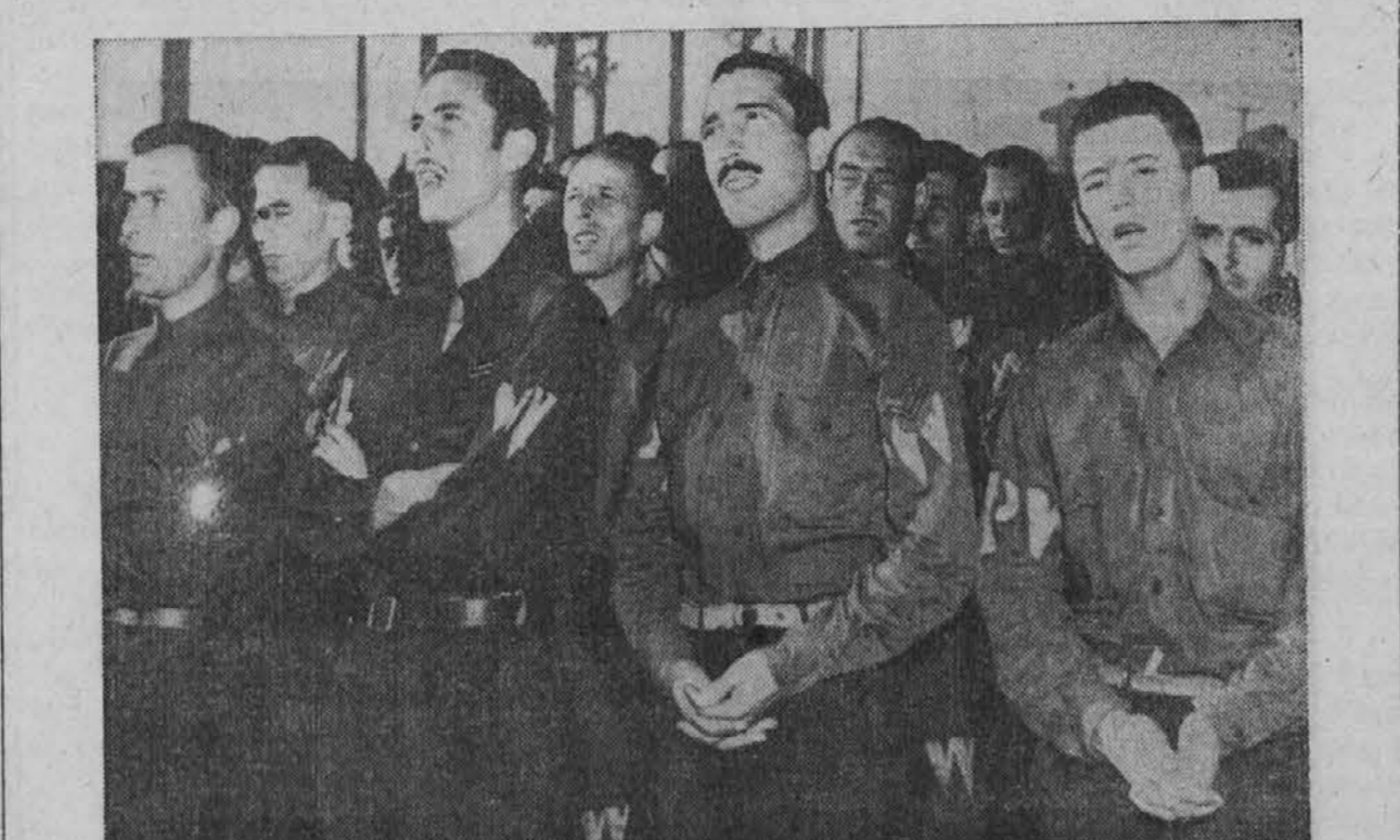
Slika nam predstavlja italijanske vojne ujetnike v taborišču Fort Benning, Ga., zbrane pri zahvalni maši pojoč zahvalno pesem, da je prenehalo vojno stanje med Italijo in zavezniki. Ti italijanski vojaki so bili zajeti od zaveznikov na Siciliji meseca julija.