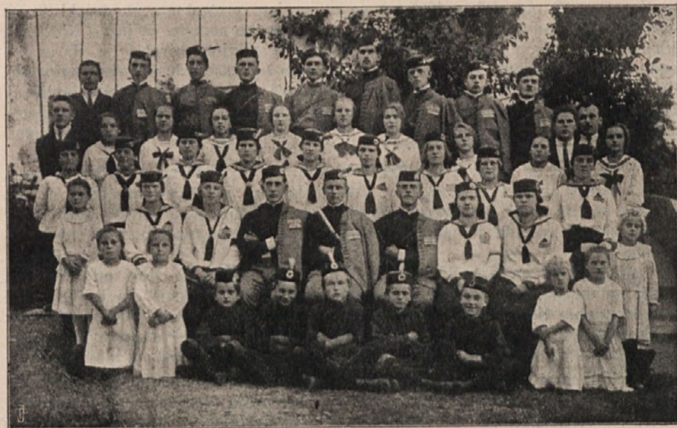
Orlovska družina v Poljanah nad Škofjo Loko.

Spel sem potrto nazaj domov, kjer je ostala družina Orlov in Orlic, ostala sama, brez šestih dobrih, delavnih borcev in sinov. Toda povrnejo se, povrnejo med nas, brate, saj smo jim pokazali ljubezen, bratstvo in zvestobo, pokazali, kako se poslavlja od zvestih bratov — orlovska družina.