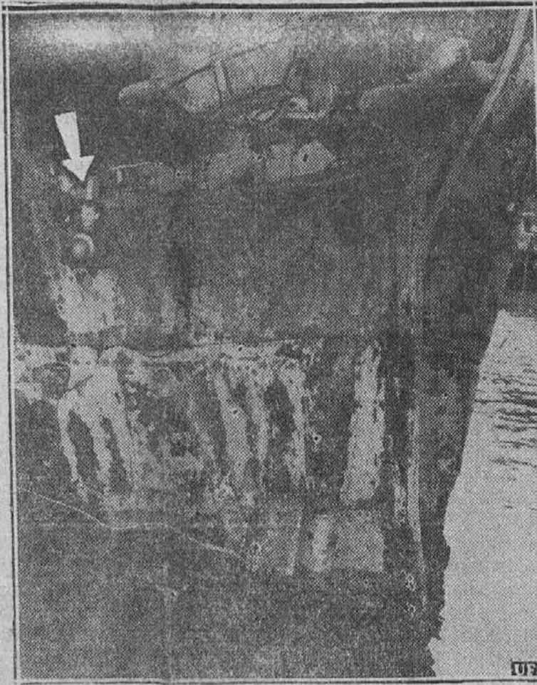
Na sliki vidimo poškodovani rilec nemškega parnika "Wiegand," ki je te dni v bližini obali države New Jersey trčil z ameriškim parnikom Lillian, ki se je potopil. Nemški parnik se nahaja zdaj v doku v New Yorku, kjer ga bodo popravili, preden nastopi povratno vožnjo v Nemčijo.