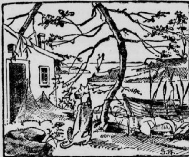
Kje je brodar?