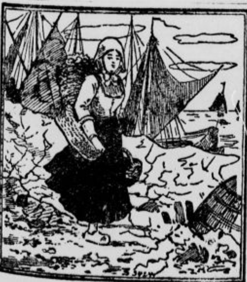
Kje je mož?