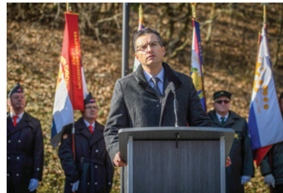
Slavnostni govornik Marjan Šarec

Frankolovski zločin je poboj sto Slovencev v Grabnu pri Stranicah pri Frankolovem 12. februarja 1945, ki so ga izvedli nemški okupatorji. Bil je povračilni ukrep za smrt enega najpomembnejših nacističnih funkcionarjev, vodje celjskega okrožja in deželnega svetnika Antona Dorfmeistra. Okupator je na jablane ob cesti, kjer se je prej zgodil napad na Antona Dorfmeistra, obesil 99 ljudi, eden pa je bil ustreljen na begu pred obešanjem.