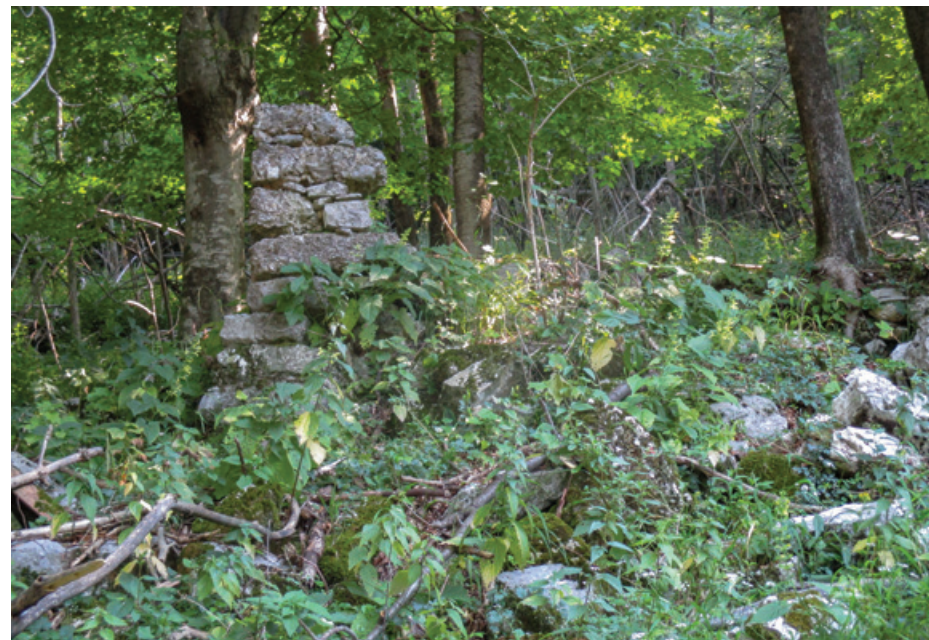
Ostanki tabora v Plazeh