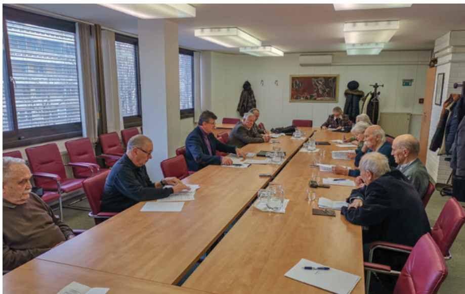
Seja sveta ZZB v Ljubljani

V Sloveniji pa tudi širše v okviru EU je premalo poglobljenega razmišljanja o tem, kaj so temeljna vodila politike – ali so resnični, življenjski interesi državljanov držav članic EU ali je temeljno vodilo zadovoljevanje interesov velikega kapitala. V osnovi se je treba zavedati večnega razrednega konflikta v človeški družbi, tistega med oblastjo in ljudstvom. V različnih zgodovinskih obdobjih se je to razredno nasprotje navzven izražalo na različne načine, npr. med fevdalcem in tlačanom, gospodarjem in sužnjem, med delavcem in kapitalistom. V zadnjih treh desetletjih pa ima to temeljno družbeno nasprotje obliko nasprotja med odstotkom in 99 odstotki ali še natančneje med transnacionalnim kapitalističnim razredom in razredom vseh preostalih državljanov sveta. Transnacionalni kapitalistični razred predstavlja okrog 1.800 milijarderjev, poimensko je znana elita tehnokracije 389 najmočnejših posameznikov, vse najpomembnejše politične in gospodarske odločitve usmerja 17 finančnih korporacij s približno 42 000 milijard dolarjev finančnega kapitala. Ta se vse bolj usmerja v obvladovanje nekdanj skupnega – javne energetske, prometne, finančne infrastrukture, zdravstva, šolstva, pokojnin, hrane, vode. Člani Sveta so veliko pozornost namenili razmišljanjem, kako vrednote in oblike delovanja v času Osvobodilne fronte uresničevati v dobro državljanov Slovenije danes. ●