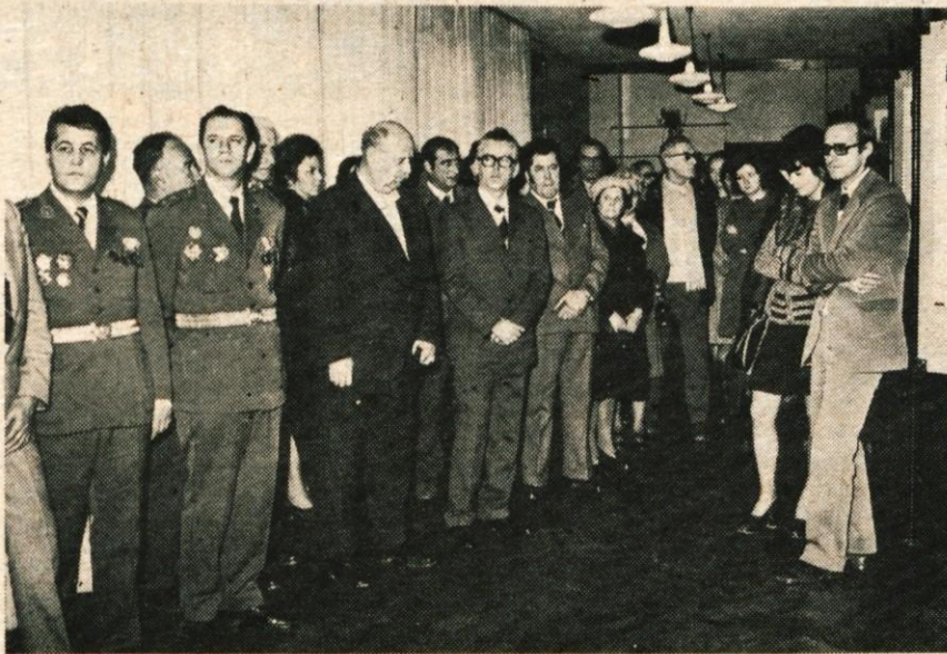
V petek dopoldne so v spodnjih prostorih doma JLA v Kranju v počastitev 22. decembra odprli razstavo »Druga grupa odredov.« Razstavo sta pripravila Gorenjski muzej Kranj in Muzej revolucije Celje. O pomenu in vsebinski zasnovi razstave je govoril Franc Benedik, sodelavec Gorenjskega muzeja. (jk)