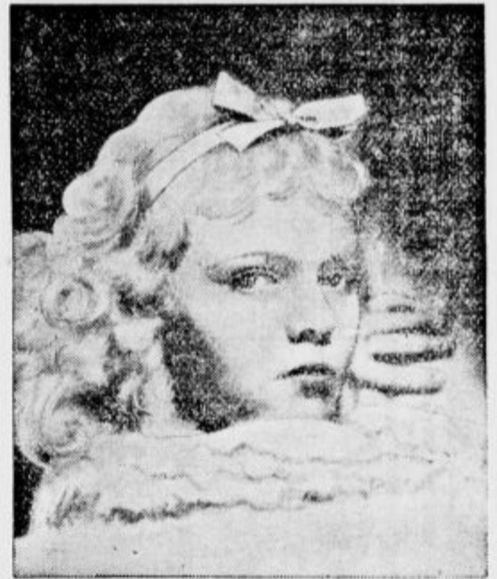
Hčerka Marlene Dietrich na platnu. Glasovita filmska zvezda Marlene Dietrich ima hčerko, katera že v zgodnji mladosti obeta ubirati stopinje za svojo materjo. Sedaj bo prvič nastopila in bo igrala carico Katarino II. v otroških letih. Njena mati pa bo igrala Katarino kot carico.