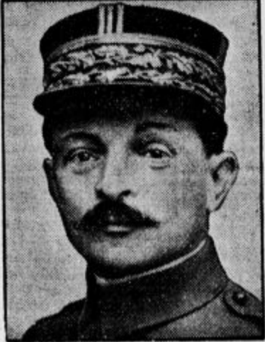
General Weygand, glavni nadzornik francoske armade, se je te dni odpeljal v Maroko, da bi pregledal tamkajšnje čete. V političnih krogih domnevajo, da namerava francoska vojska izvršiti hud sunek proti vstašem v Maroku, ki se neprestano upirajo.

Henko za namakanje perila in za omehčanje trde vode, Persil za izkuhanje, to je pravilen način pranja. Ravnajte se točno po navodilu in dosegli boste brez truda perilo belo kot sneg. Persil in Henko sta domača izdelka ter se dobivata v vsaki trgovini.