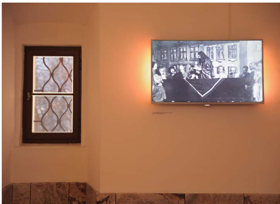
Digitalizirani posnetki odrske uprizoritve Škofjeloškega pasijona ob Obrtno–industrijski razstavi, Škofja Loka, 1936, foto Janko Šelhaus, fototeka Loškega muzeja.

Tovrsten vključujoč in interdisciplinaren pristop je ključen pri razstavljanju žive dediščine, ideala muzejskega dela. Pasijonska zbirka bo tako še dodatno podkrepila našo tezo, da v muzejih ne hranimo pepela, ampak ogenj, ki je tlel skozi stoletja.