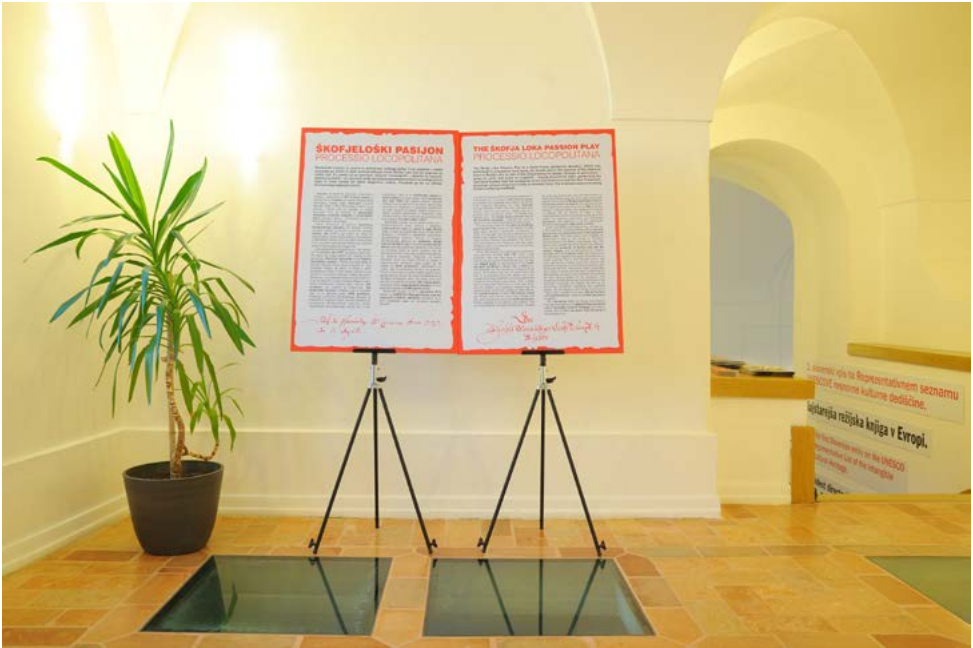
Uvodni tekst k razstavi o Škofješkem pasijonu v slovenskem in angleškem jeziku.