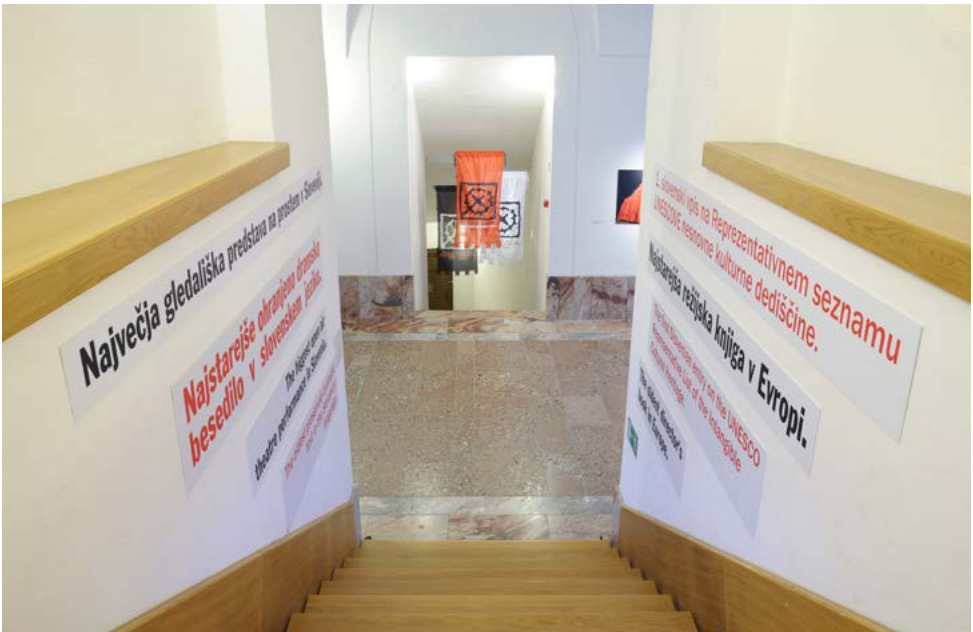
Pogled na vstop v razstveni prostor, foto Janez Pelko.