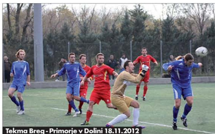
Tekma Breg - Primorje v Dolini 18.11.2012