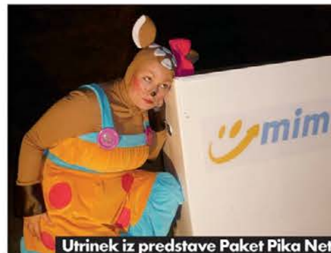
Utrinek iz predstave Paket Pika Net