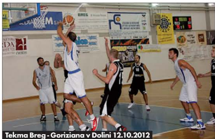
Tekma Breg - Goriziana v Dolini 12.10.2012