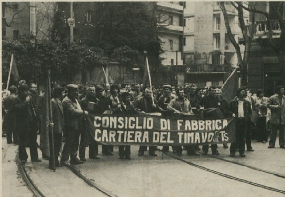
Skoraj vsak dan se po tržaških ulicah odvijajo stavkovne manifestacije

Zato je potrebno, da se vse demokratične sile izrečejo za odstop občinskega in pokrajinskega odbora. Potrebno je, da se v Trstu nekaj korenitega spremeni. Levica naj gre z levico, desnica z desnico. Za uspeh demokratične alternative je potrebno, da se v našem mestu spopadejo napredne in reakcionarne sile, na jasnih programskih izbilih in opredelitvah. Vsak mora vedeti, tudi ko glasuje, v katero smer želi potisniti Trst in deželo. Naši predlogi za demokratično alternativo so jasni in jih lahko strnemo v nekaj besedah, ki so vsakomur razumljive: mir, delo, kultura, sožitje, enakopravnost.