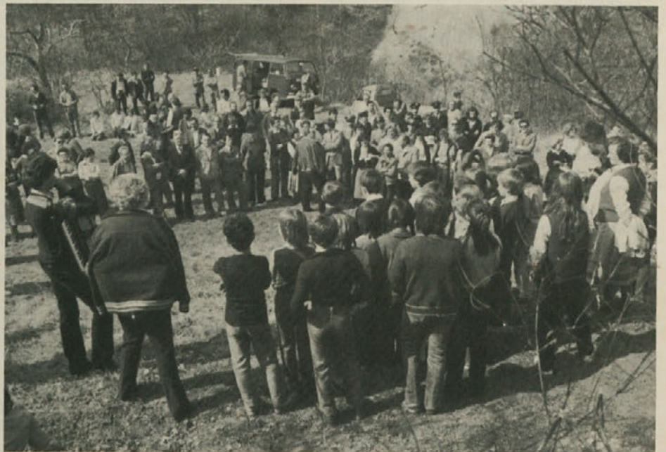
V nedeljo so v Botaču zopet odprli mejo. Lepo vreme je privabilo veliko število ljudi. Srečali so se tudi šolarji iz dolinske občine in Kozine. V gledališču «F. Prešeren» pa je potekal seminar o zaščiti doline Glinščice.