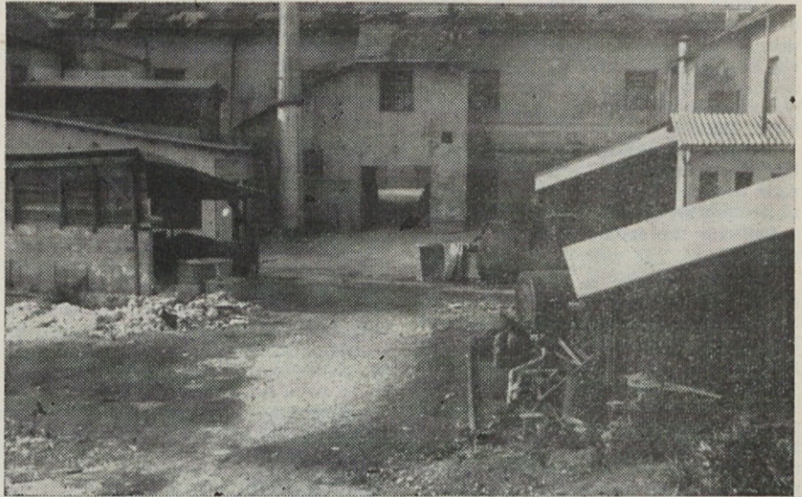
Pogled na notranje dvorišče, katere ga izgled nam ni ravno v ponos

Največji delež popravil je prevzel zavod sam, kakor tudi vso odgovornost za pravilno izvajanje. Ker je bilo nekaj del manj važnih, se je za to delo posebej pogodbeno obvezalo gradbeno podjetje »Bežigrad« v Ljubljani. Njih je predlagal zavod, ker so pri podobnih delih stalno v sodelovanju. Nam je to tudi popolnoma odgovarjalo. Zahtevali smo le hitro izvršitev in dobro sodelovanje obeh ekip. Vendar smo kmalu ugotovili, da je sodelovanje in hitra izvršitev del samo velika obljuba, ki ni osnovana na stvarnih razmerah. Največ se je zataknilo pri dobavi vezi, ker nikjer ni bilo sprva najti odgovarjajočega materiala. Potem so našli močnejšo dimenzijo in dali izdelati, ne da bi se preje prepričali, kako bodo montirali — sodelovanja torej ni bilo opaziti. Problemov je bilo veliko preveč in delavci, ki so dela izvajali, so te probleme postavljali vzdrževalni službi, da jih rešuje,