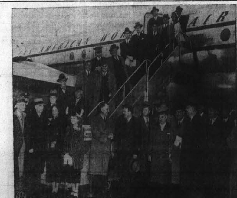
Zračni orjak obiskal New York. — Juan T. Trippe, predsednik Pan American World Airways je pozdravil newyorškega guvernerja Thomas E. Deweya malo prej ko so se podali na polet s tem zračnim orjakom za 15 minut nad mestom in okolico. Ta "Boeing Stratocruiser" ima prostora za 75 oseb in ima sobe v dveh nadstropjih in bo kmalu nastopil prekoceansko službo.