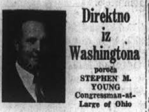
Direktno iz Washingtona poročila STEPHEN M. YOUNG Congressman-at-Large of Ohio

Svet gre nasproti — demokraciji. Komunizem je na umiku. Amerika je prevzela vodstvo v boju za svobodo. Tovariši, vzemite na znanje.