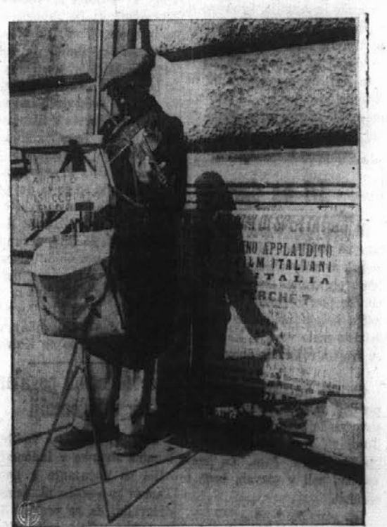
Skriti talent. — Rimski berač izvorno igra na violino, na stojalu pa ima napis: "Kdor more naj pomoča brezposelnemu!" Ampak ta goslar noče dela kot muzikant kot pove spodnji napis, ampak želi dobiti delo kot mehanik.

Sodnik: "Policijskemu psu, ki vam je sledil, ste ponujali klubaso."