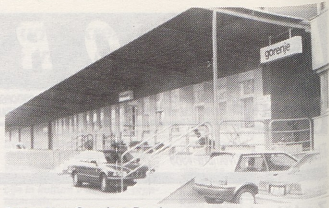
Del prostorov Gorenja na Dunaju.