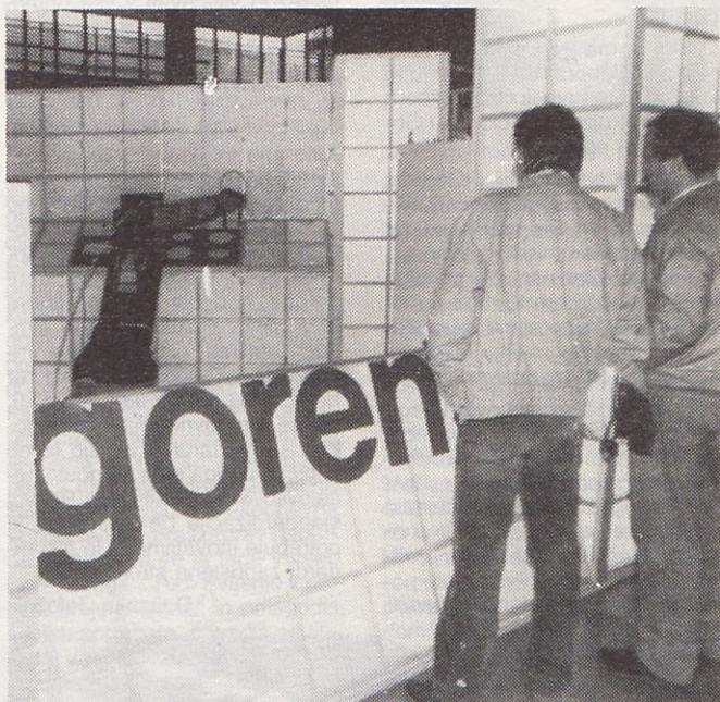
Na razstavi JUROB v Ljubljani Gorenje Procesna oprema razstavlja tudi robot Tralffa.

Vse naše delo in aktivnosti zasledujejo osnovni cilj – organizirati se in delati tako, kot delujejo podjetja, organizirana na najsoodnejših spoznanjih in izkušnjah razvitega gospodarstva Evrope in sveta. To pa je, kot smo že večkrat doslej poudarili, tudi cilj delavcev Gorenja. Ustvariti želimo in moramo ob višji kakovosti dela tudi višjo kakovost življenja!