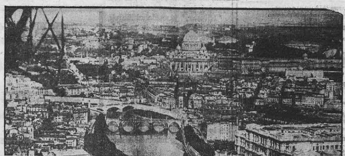
WASHINGTON, D. C.—One of the principal military objectives in the recent bombing of Rome was the marshalling yard, which is a large railway switch yard where trains are made up and therefore of great importance to the Axis war effort and for the movement of German troops. Italians are acting to prevent additional bombings by declaring the city, general aerial view of which is shown, as open and undefended.